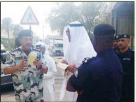
الخالد والذريعي وسفاح في موقع حريق مصفاة الشعبية

قام محافظ الأحمدى الشيخ فواز خالد الحمد الصباح بجولة تفقدية لموقع الحريق الذي نشب ظهر أمس في وحدة تكسير الزيت الثقيل بمصفاة الشعبية، للوقوف على جميع تفاصيل الحادث، حيث رافقه خلال الجولة مدير عام مديرية أمن محافظة الأحمدى بالإقامة العميد عبدالله سفاح الملا.