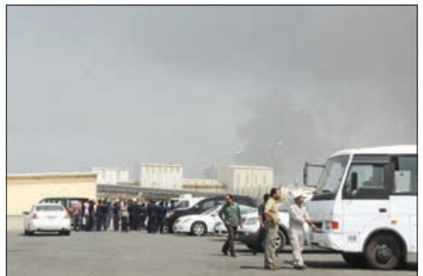
عمال مصفاة الشعبية بعد إجلائها من الموظفين