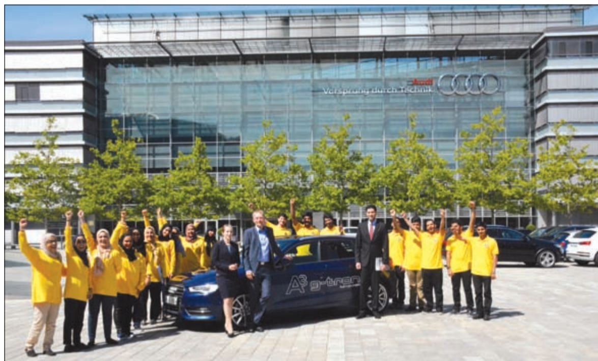
سفراء شباب الإمارات خلال زيارتهم لمقر شركة أودي الرئيسي وسيارة أودي A3 e-tron التي تعمل على غاز e-gas

كبيرة في جميع مجالات الإنتاج والعمل لديها في الحفاظ على البيئة والموارد الطبيعية وزيادة الكفاءة في الإنتاج. وشاهد السفراء الشباب سيارة أودي A3 e-tron والتي تعتبر جزءاً من خطة لبناء السيارات التي تسير بالطاقة المستدامة الخاصة بالعلامة ذات الحلقات الأربعة حيث يمكن لحرك السيارة من حجم 1,4 ليتر TFSI وقوة 110 حصّة العمل على الغاز الطبيعي أو e-gas التي تنتج أودي أو الجازولين. وعند استعمال e-gas التي تنتج أودي، لا يساهم محرك e-tron في انبعاثات ثاني أكسيد الكربون على الإطلاق.