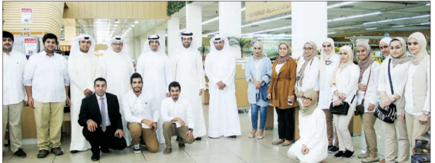
الشباب خلال الدورة التدريبية

وقال المطيري إن آلية عمل الوزارة تقوم على التعاون والتكامل بين مختلف الجهات والهيئات المعنية بأمور الشباب ومؤسسات المجتمع المدني من خلال مشاريع استراتيجية شبيهة تساهم في تحقيق التنمية المجتمعية في شتى مجالاتها. وشدد على أهمية تضافر جميع الجهود من أجل النهوض بالشباب من خلال وضع خطة تسمح لجميع المؤسسات الحكومية والأهلية ومنظمات المجتمع المدني للإسهام في الارتقاء بهذه الشريحة الأساسية من المجتمع وإعداد جيل يعمل على المشاركة في حاضر الكويت ومستقبلها.