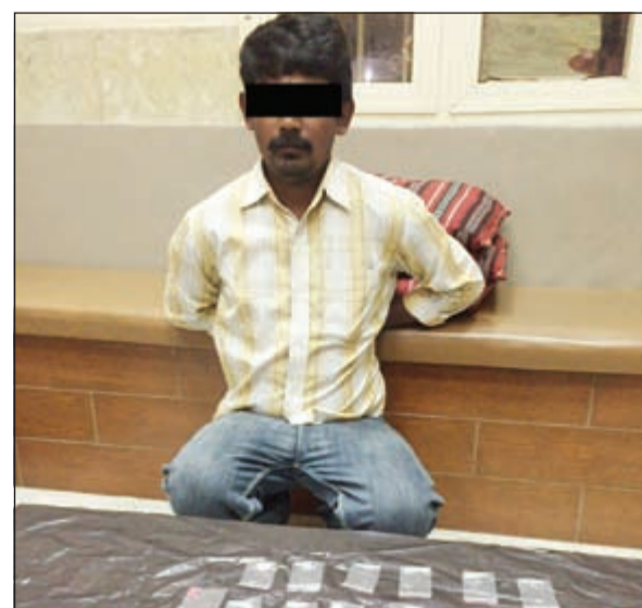
الشبو والحبوب المضبوطة بحوزة الوافد