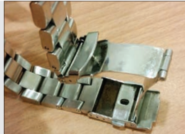
الحشيش للتعاطي لا للتاجر

احال مراقب عام مطار الكويت الدولي سليمان الفهد الي الادارة العامة لمكافحة المخدرات وافدا عربيا بعد محاولته اخفاء كمية من الحشيش بطريقة مبتكرة للغاية، وذلك بوضع الحشيش في سير الساعة. وبحسب مصدر جمركي فإن رجال الجمارك اشتبهوا في الوافد لدى دخوله المنطقة الجمركية حيث ظهرت عليه علامات الارتباك الشديدة، ليتم اقتياده الي غرفة التفتيش الذاتي وضبط الحشيش. وأقر الوافد بأنه مدمن حشيش وإن المضبوطات للتعاطي.