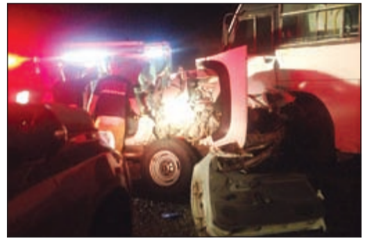
الحادث المروري تصادم وجهها لوجه