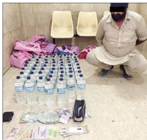
.. والخمور وحصيلة البيع امام احد تجار التجزئة