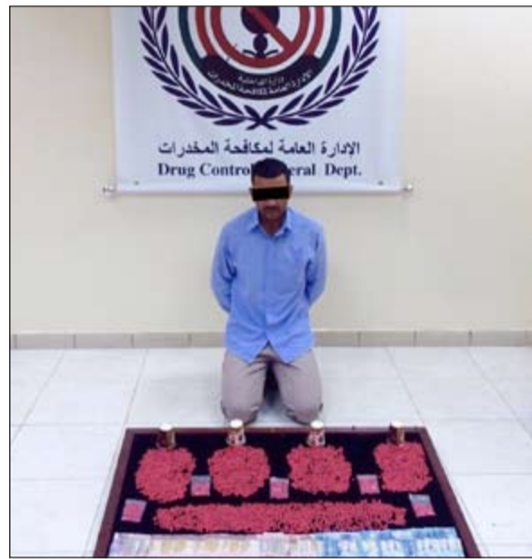
الوافد المصري وامامه المضبوطات من الحبوب

أخذ إذن من النيابة العامة واستدراج الوافد لبيع 20 حبة مقابل 40 ديناراً ليتم ضبطه وبالإنتقال الي منزله عثر معه على كمية ضخمة من الحبوب تقدر بـ 10 آلاف حبة ومبالغ مالية والتي أقر بانها حصيلة البيع.