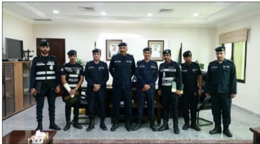
اللواء فهد الشويح مكرماً الضباط والافراد الذين ضبطوا الوافد