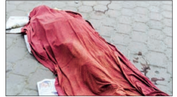
الجثة احيات إلى الطب الشرعي

لفظ بدون انفاسه بعد ان اقدم على الانتحار برمي نفسه