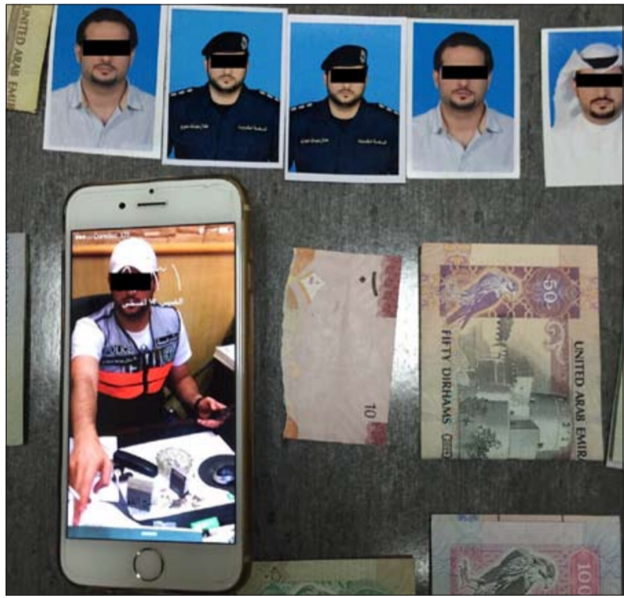
صور متعددة للضابط المزيف