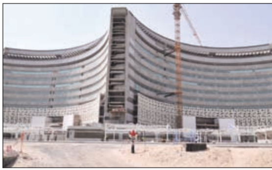
جانب من أعمال مستشفى جابر

وأشار إلى أن الرمال المستخدمة في معالجة الأرض يتم استخراجها من مياه البحر بطريقة بيئية حديثة تلافياً لحفر الدراكيل واتلاف الشوارع بسبب عمليات النقل المحتملة.