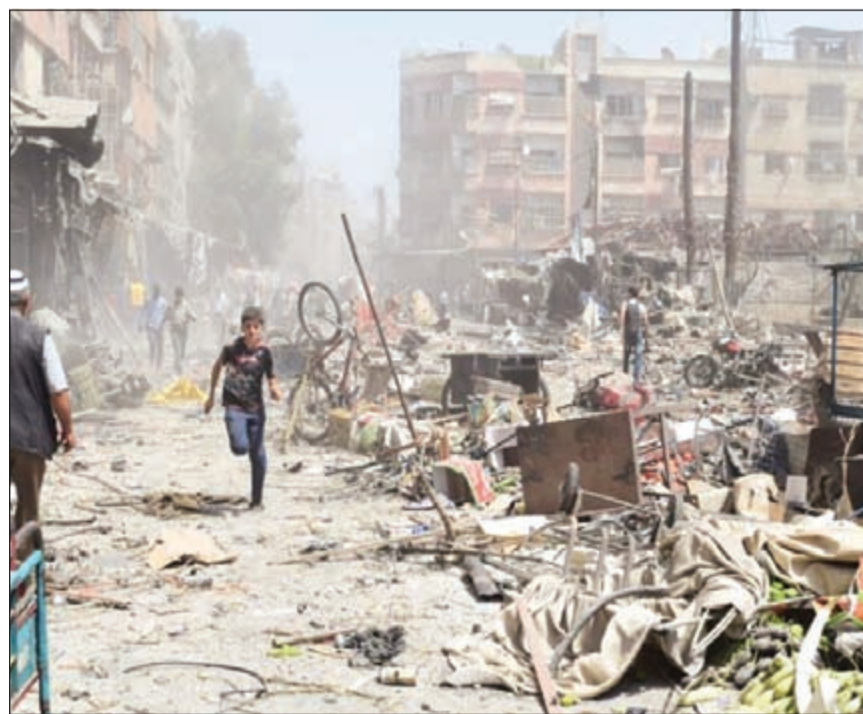
صورة نقلتها شبكة «شام» لجانبي من الممار الذي خلفته الغارات على دوما أمس

بيروت - أ.ف.ب: قتل 80 شخصاً على الأقل وأصيب أكثر من 200 شخص إثر الغارات الجوية التي شنها طيران النظام السوري على سوق شعبية في مدينة دوما معقل المعارضة قرب دمشق، بحسب ما ذكر ناشطون ومنظمات حقوقية. وقال المرصد السوري لحقوق الإنسان «إن النظام نفذ أربع ضربات على سوق شعبية وسط مدينة دوما ما أسفر عن مقتل نحو 80 شخصاً أغلبهم من المدنيين - وإصابة أكثر من 200 بجروح». وأوضح المرصد ان «الناس تجمعوا بعد الضربة الأولى من أجل إسعاف الجرحى ثم توالت الضربات».