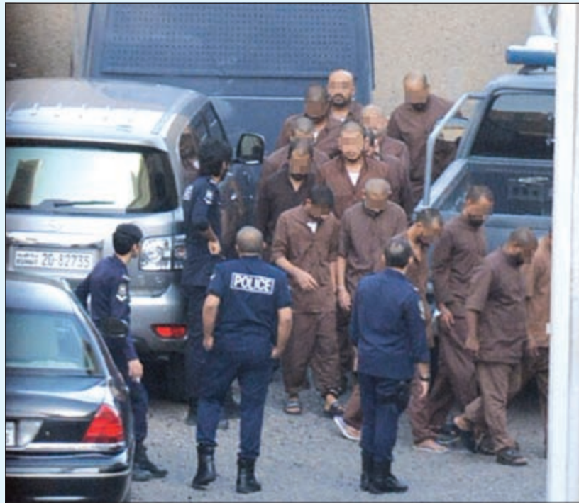
المتهمون لدى وصولهم إلى قصر العدل وسط حراسة مشددة (ريليش كومار)

■ المتهم الأول رصد المسجد المنكوب ليلة الواقعة رفقة القبايع ولا سند لدفاعه الوهين والواهي من أنه قصد التفجير دون إيذاء المصلين ■ المتهمون أقرروا بانتماهم لتنظيم الدولة واشتركت النسوة في إخفاء الهواتف بهدف التغطية على الجريمة المروعة نص مرافعة النيابة من ص 13 إلى 15