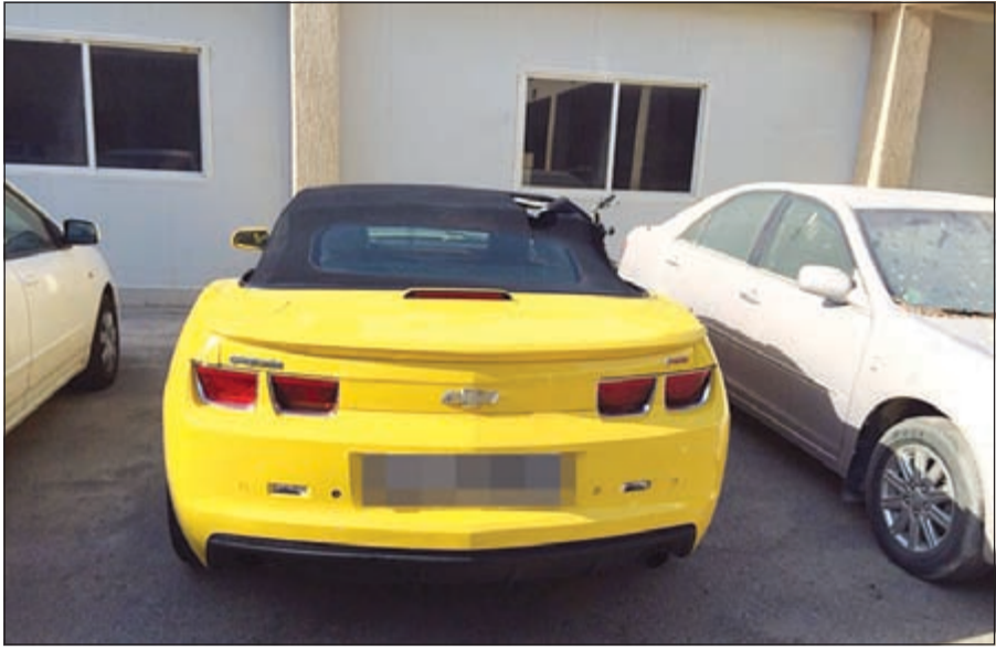
السيارة التي ضبط فيها اللبناني وهي مؤجرة