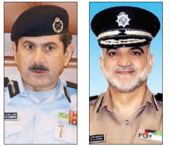
اللواء خالد المكراد