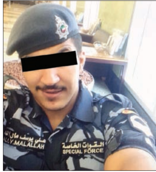
صورة للشاب من على هاتفه الخاص