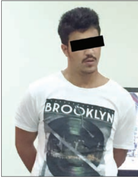
الشاب اللبناني بعد القبض عليه