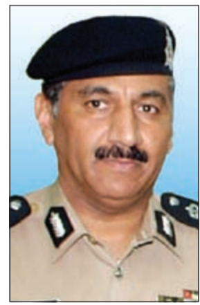
اللواء فهد الشويح

قاد الحس الأمني أحد رجال الأمن لتوقيف قائد مركبة رياضية قرب مخفر الأندلس، حيث خرج منها وكان مرتدياً زياً مدنياً، وعند سؤاله عن رخصة القيادة أفاد بأنه خرج من المخفر بعد زيارة صديقه المحتجز على ذمة تبادل بالضرب، وأرذف المصدر أن قائد الرياضية أفاد بأنه مواطن ويأعطاء الاسم والاستعمال واضح عدم صحة الاسم وعند التدقيق على المركبة اتضح أنها تعود لإحدى شركات الاستئجار.