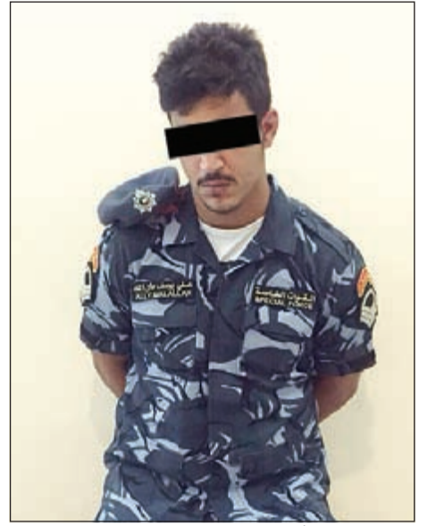
الوفد اللبناني بعد أن ارتدى الزي العسكري لمعرفة انطباق القياس عليه