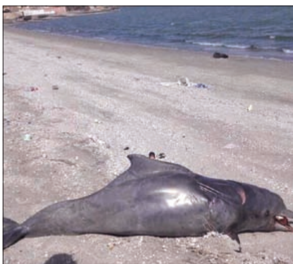
الدولفين النافق على ساحل الدوحة

تستعد وزارة الصحة لمخاطبة ديوان الخدمة المدنية لاستحداث درجات وظيفية لغير الكويتيين من الوظائف الطبية (أطباء - صيادلة - ممرضين - فنيين) لسد حاجة التوسعات والإنشاءات الجديدة، والتي يبلغ عددها 10 مشاريع متوسطة الأجل، ومراكز صحية يعترزم افتتاحها في العامين 2016 و2017. وأقادت بأن من الإنشاءات الجديدة: إدارة خدمات كبار السن، بالإضافة إلى إدارة قيد