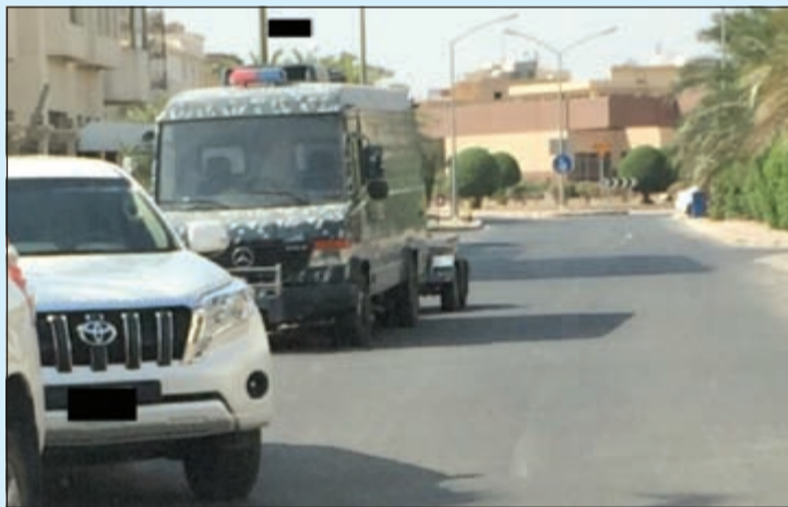
القوات الخاصة أمام أحد المنازل المشتبه بها في منطقة العدان