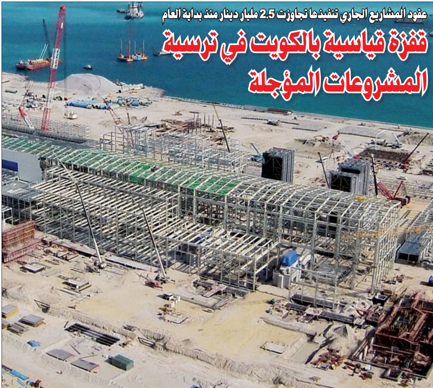
مقابلة لشركات المقاولات الرئيسية العاملة في المنطقة بعد ترسية أكبر المشاريع المؤجلة بالكويت