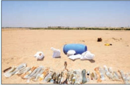
جانب من الأسلحة التي تم العثور عليها في مزرعة العبدلي