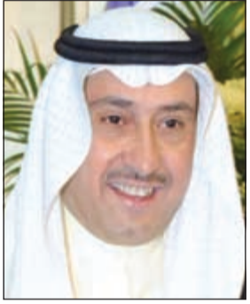
الشيخ فيصل الحمود

المواد شديدة الانفجار: إن رجال الأمن ووزارة الداخلية بريانها الشجاع وقيادتها اليقظة وأبطالها المتمرسين، جعلوا من محاولات المتربصين بدولتنا الحبيبة هباءً منثوراً لا وزن له، وجعلوا المواطن والمقيم ماشياً وراكباً وناثماً على إرهابه يتنفس الأمان بعد الحاقدون ولا نامت أعين الجبناء والكويت أقوى وأصلب فوق كل ومحصنة من الإرهاب البغيض والأوفياء، اللهم احفظ الكويت من كل سوء ومكروه وأدم علينا الأيمن والأمان في ظل قيادة صاحب السمو الأمير وسمو ولي العهد،