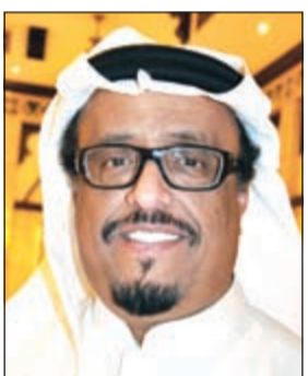
الفريق ضاحي خلفان

وأوضح ان حزب الله يتكسب على تعميق الخلافات الذهبية والطائفية في العالم العربي. وزاد: حزب الله ينفذ استراتيجية هدفها تعميق الخلافات وتفتيت الأمة العربية، واليوم أعلم بمحض الصدفة ان الأسلحة المضبوطة في دولة خليجية تعود الى أتباعه. ونساءل: هل ولاية الفقيه تتحلب ان تدفن القنابل والأسلحة والذخيرة كي تغتال الاستقرار في مجلس التعاون؟ هذا عمل إرهابي، ألا تدين الإرهاب الذي يرتكبه حزب الله إن كان دون علمك؟