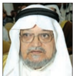
د. عبدالرحمن السميطة «رحمه الله»

– الهندية متميزة.. وحجم التجارة بينهما وصل إلى 14.58 مليار دولار في 2014/2015 04