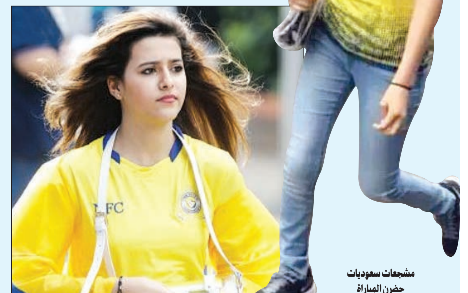
مشجعات سعوديات حضرن المباراة

واستغلت العوائل التي تقضي فترة الإجازة هناك الفرصة لحضور اللقاء، ولوحظ حضور الجنس الناعم بشكل لافت، حيث ارتدت كل مشجعة زي فريقها وهو ما أصفى بعداً آخر للمباراة.