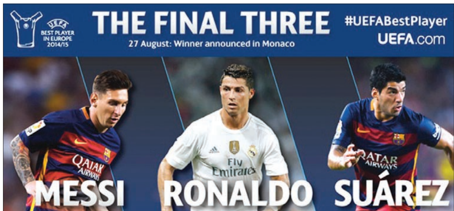
البرغوث الأوفر حظاً في نيل الجائزة

البجيجي إيدن هازار «تشلسي الإنجليزي»، فيما حل الفرنسي بول بوغبا «يوفنتوس» عاشراً.