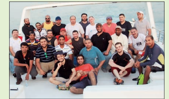
بعض الموظفين المشاركين في الرحلة

الموظفين في رحلتي الذهاب والعودة، مما أتاح للموظفين فرصة اللقاء والاستمتاع بالأنشطة الترفيهية بعيداً عن أجواء العمل. وكانت الرحلة فرصة طيبة للاستمتاع بأجواء البحر في يوم مشمس جميل بجزيرة كبر التي تعتبر من أجمل الجزر الكويتية التي تحتضن طيور المحيط الهندي وتتميز بمياهها الهادئة الصافية ورمالها الناعمة حيث وفرت لموظفي «بيتك» قضاء وقت ممتع اتسمت فيه الأجواء بالمودة وسادت روح المحبة كما هي دوماً بين أبناء الأسرة الواحدة.