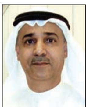
م. علي البوابة

عاصمة الثقافة الإسلامية - التي تسند سنويا إلى ثلاث مدن إسلامية عريقة واحدة من كل من المناطق الإسلامية الثلاث العالم العربي وإفريقيا وآسيا) وتمتد الاحتفالات والتظاهرات في هذه المدن المختارة عاما كاملا. وذكر البوابة أنه تم اختيار الكويت لتكون إحدى المدن الثلاث المحتفى بها بوصفها عاصمة الثقافة الإسلامية لعام 2016 إلى جانب كل من مدينة (مالية) في جمهورية مالديف ومدينة (فريتاون) في جمهورية سيراليون بناء على القرار الصادر في اجتماع وزراء الثقافة للمؤتمر الإسلامي السادس الذي عقد في مدينة باكو بجمهورية أذربيجان في أكتوبر عام 2009. وبين أن خارطة الاحتفالية تتضمن العديد من الأنشطة والفعاليات الثقافية والفكرية والفنية المتنوعة التي تعنى