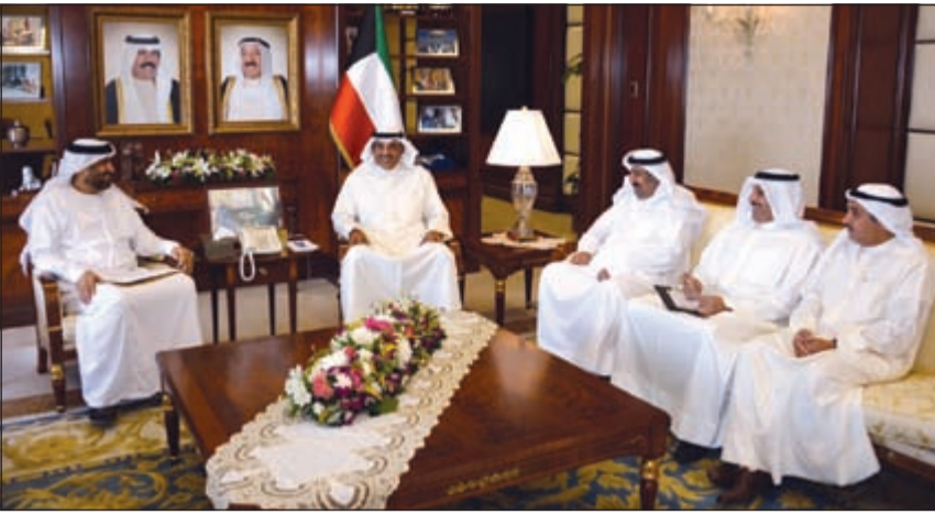
رئيس مجلس الوزراء بالإنابة ووزير الخارجية الشيخ صباح الخالد أثناء استقبله سفير الإمارات رحمة الزعابي