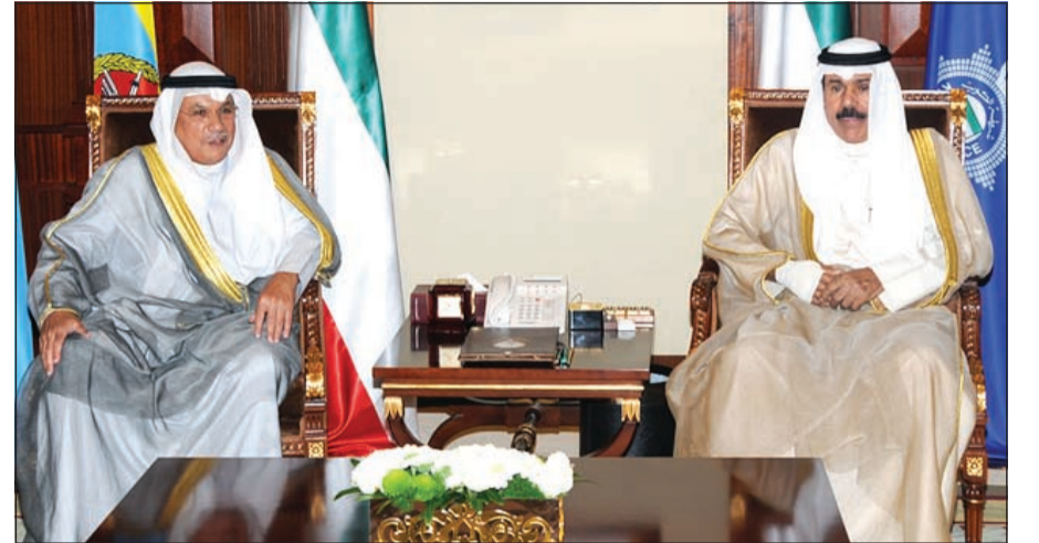
سمو نائب الأمير وولي العهد الشيخ نواف الأحمد خلال استقباله وزير الدفاع الشيخ خالد الجراح

استقبل سمو نائب الأمير وولي العهد الشيخ نواف الأحمد، حفلة الله ورعاه، بقصر بيان صباح امس رئيس مجلس الوزراء بالإنابة ووزير الخارجية الشيخ صباح الخالد. واستقبل سموه أيضاً نائب رئيس مجلس الوزراء ووزير الدفاع الشيخ خالد الجراح.