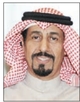
السفير الشيخ علي الخالد

علاقات التعاون بين البلدين إلى آفاق أرحب. ولفت إلى ما حققته زيارة سمو رئيس مجلس الوزراء إلى إيطاليا في سبتمبر 2014 من نتائج إيجابية، مشيداً من جانب آخر بمشاركة الكويت وحضورها القوي في معرض «إكسبو ميلانو 2015» من خلال أنشطة ناجحة قدمها جناحها في المعرض العالمي.