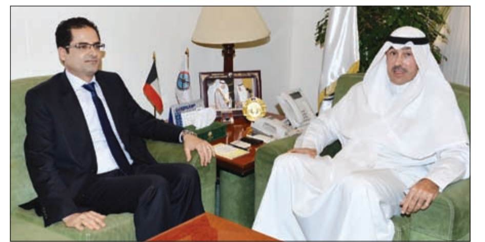
الشيخ فواز الخالد مستقبلاً السفير التونسي نور الدين الري

استقبل محافظ الأحمدى الشيخ فواز الخالد في مكتبه بديوان عام المحافظة سفير الجمهورية التونسية لدى الكويت نور الدين الري، بمناسبة انتهاء فترة عمله بالكويت وعودته إلى بلاده، حيث تمنى الخالد جهوده على امتداد فترة عمله بالبلاد في دعم العلاقات الثنائية الوثيقة التي تربط بين البلدين الشقيقين وتعزيزها في جميع المجالات، خاصة على مستوى الأنظمة الإدارية المحلية وعلى صعيد المحافظات والمناطق. كما تقدم المحافظ بالشكر والتقدير إلى