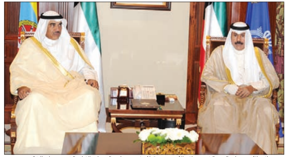
سمو نائب الأمير وولي العهد الشيخ نواف الأحمد مستقبلاً رئيس مجلس الوزراء بالإنابة الشيخ صباح الخالد

حضر اللقاءين وكيل وزارة الخارجية بالإنابة السفير وليد الخبيزي ومدير إدارة مكتب النائب الأول لرئيس مجلس الوزراء ووزير الخارجية بالإنابة السفير صالح اللوغاني وعدد من مسؤولي وزارة الخارجية.