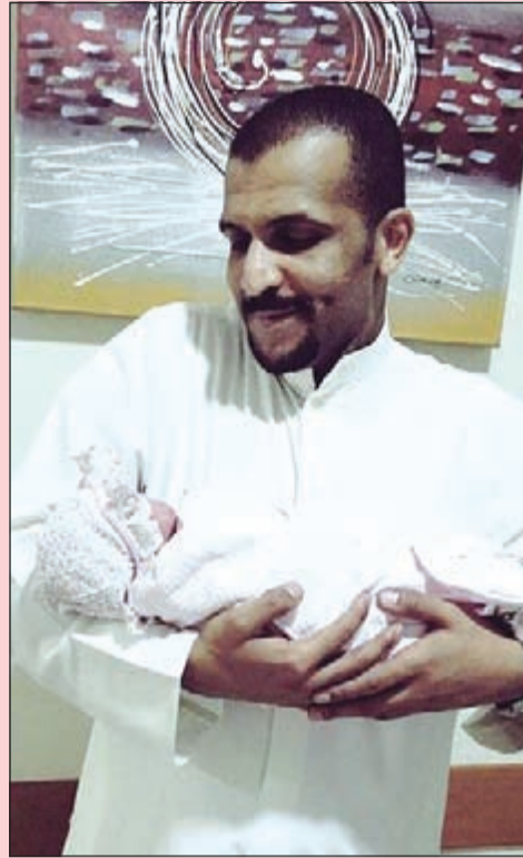
الفرج مع ابنته