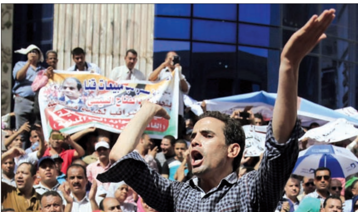
عاملون بإدارة الجمارك خلال احتجاجات تطالب بتعديل قانون الخدمة المدنية في القاهرة أمس الأول

مخاطبة بقانون 47 هي نفسها المخاطبة بقانون الخدمة المدنية وباستثناء فقط رئاسة الجمهورية ورئاسة الوزراء فيما يتعلق بالتعيينات فقط. ونوه إلى انه تم إجراء حوار مجتمعي حول القانون مع كل فئات المجتمع حول القانون قبل صدوره، لافتا إلى أن الدستور أكد أن العمل في الحكومة هو حق ولكن دون واسطة أو محسوبية.