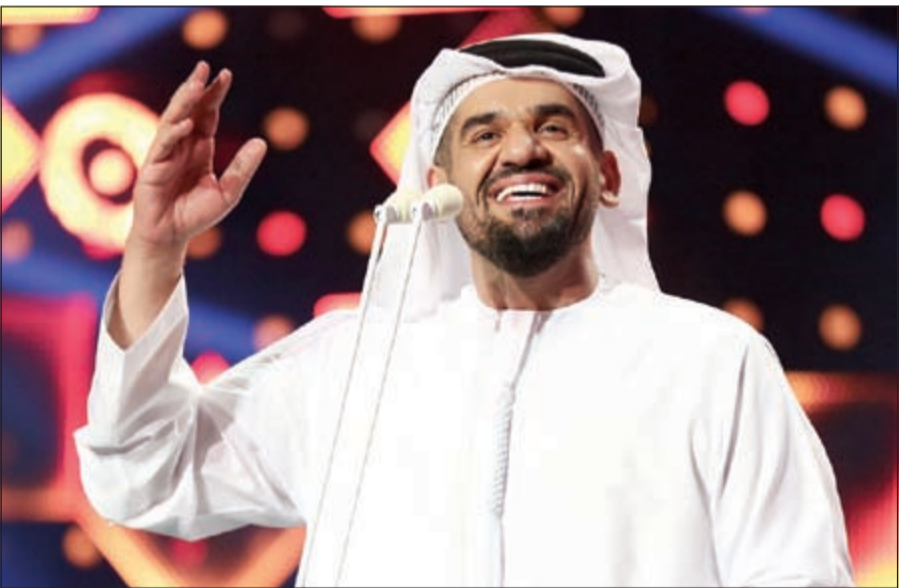
الجسمي اثناء الحفل

وجمهور عماني ولا أروع، شكرا ظفرك.. شكرا عمان». ومن على مدرجات المسرح، تعالت هتافات الشباب والعائلات الحاضرة مع انغام الأغنية العمانية «حلوه عمان» التي قدمها الجسمي للجمهور تعبيرا عن حبه واحترامه للسلطنة وأهلها، ليستأنز بعدها على الهواء مباشرة شاعر الأغنية يعرب عبدالحميد وملحنها ياسر نور الدين، عن غنائه للأغنية لأنهما صاحبا الحقوق وكون من الاحترام والتقدير لهما، لتأتي المفاجأة بوجودهما بين الجمهور حاضرين، ليتقدم إليهما ويسلم عليهما ويشكرهما، ثم التقط معهما صورة تذكارية على المسرح.