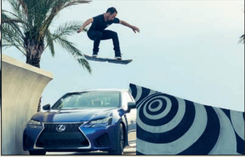
سيارة لكزس GS F تشارك في فيلم خاص بلوح التزلج الطائر من «لكزس»