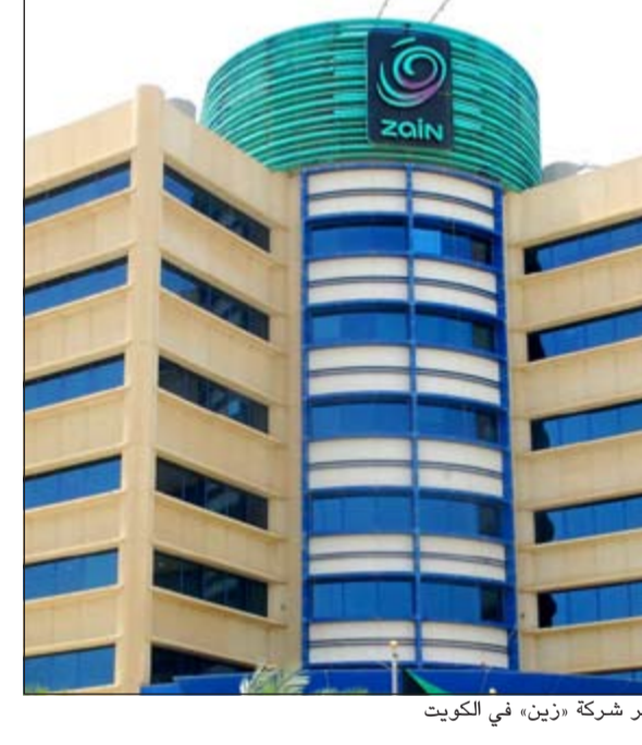
مقر شركة «زين» في الكويت

بيروت- (كونا): أعلن وزير الاتصالات اللبناني بطرس حرب أمس الأول قبول طلبات 6 شركات عالمية بينها مجموعة (زين) الكويتية للمشاركة في مناقصة إدارة شبكتي الهاتف الخليوي في لبنان. وقال حرب في مؤتمر صحافي إن الإدارة المشرفة على المناقصة قبلت طلبات 6 شركات دولية تقدمت بالمستندات المطلوبة وسددت مبلغ التامين فيما رفضت طلب شركة (أوراسكوم) المصرية لأنها لم تتقيد بتقديم الوثائق التمهيدية خلال المهل المحددة في دفتر الشروط الخاصة بالمناقصة. وأشار إلى أن الشركات التي قبل طلبها للمشاركة في المناقصة هي (فودافون) البريطانية و(أورنج) الفرنسية و(ديكتون) التابعة لشركة (دويتشه تيليكوم) الألمانية و(ماكسيس) الماليزية و(ترك سل) التركية إضافة إلى شركة (زين) الكويتية. واعتبر حرب أن مشاركة هذه الشركات التي تعتبر من الأكبر عالميا في مجال الاتصالات بعد إنجازا ونجاحا كبيرا في الخطوة الأولى من المناقصة، لافتا إلى أن المناقصة ستجري في الثامن من سبتمبر المقبل، حيث ستقوم الإدارة المشرفة بعدها بفض العروض المقدمة من الشركات. يذكر أن مجموعة (زين) تدير شركة (تاتش) في لبنان بالنيابة عن الحكومة اللبنانية منذ يونيو عام 2004 وتمتلك الشركة حصة سوقية تبلغ نسبته 53% وتقدم الخدمات الأكثر من مليوني مشترك في البلاد.