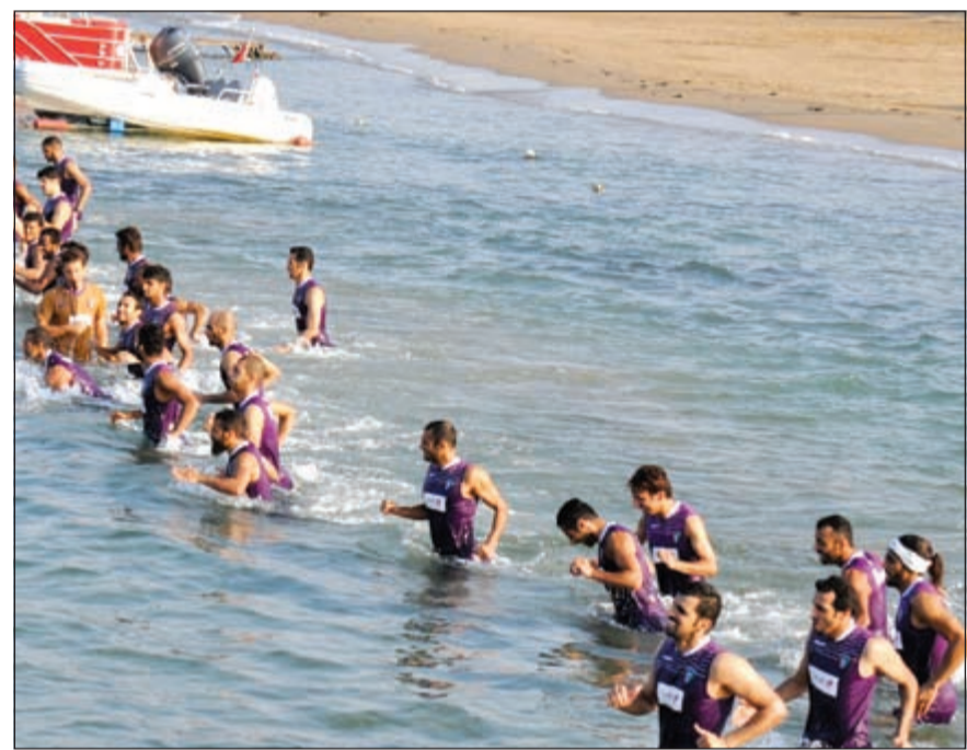
تدريبات لياقية بحرية قوية خضع لها اللاعبون صباح أمس