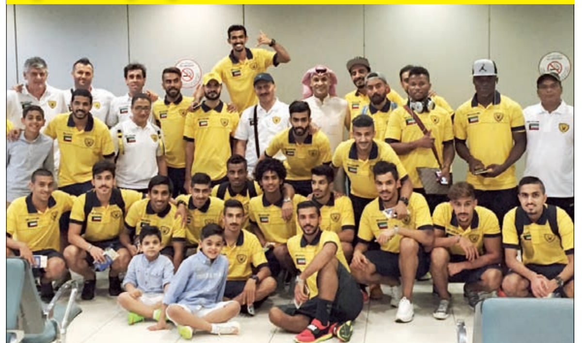
لاعبو القادسية قبل مغادرتهم إلى الإمارات