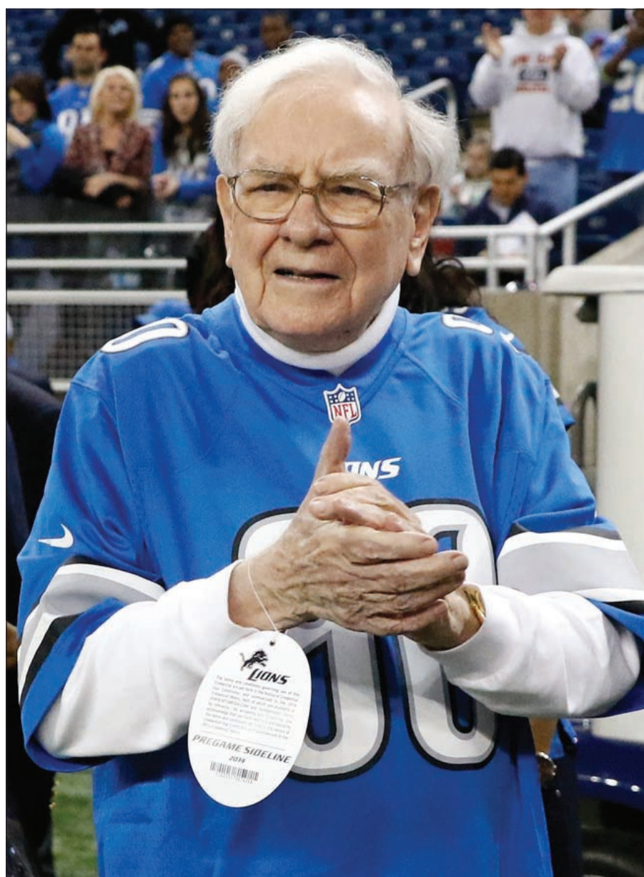
وارن بافيت أغنى أغنياء العالم وملمم الاستثمار العالمي يبدو نشيطا دائما رغم كبر سنه ومتحمسا لإعطاء نصائح شبابية لصناعة النجاح والثروة

معركة على تحقيق العوائد النفطية قد تخلق مشاكل بين إيران وروسيا والسعودية