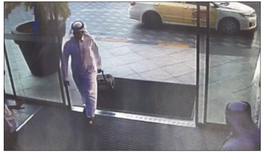
الشخص المشتبه به لدى دخوله إلى السوق الشهير مصطحبا شنطة تاجر على عجلات

اتخذت إجراءات استثنائية حول المجمعات ودور العبادة