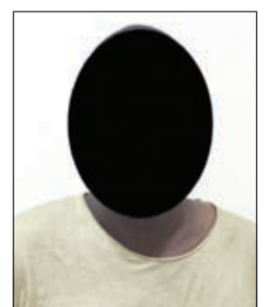
المتهم ضبط بعد 10 قضايا

تمكنت إدارة مباحث محافظة العاصمة التابعة للإدارة العامة للمباحث الجنائية من ضبط مقيم من الجنسية الاثيوبية، وذلك بعد ورود عدد البلاغات عن قيام بارتكاب العديد من جرائم السرقة عن طريق التتبع وكسر المركبات في كل أنحاء البلاد وبناء على تلك المعلومات تم تكثيف التحريات لضبطه وبعد التأكد من صحته، تم اتخاذ الاجراء القانوني وضبطه بمسكنه، وبمسوالة عما قام به أكد انه كان يقوم بمراقبة البنوك وعند