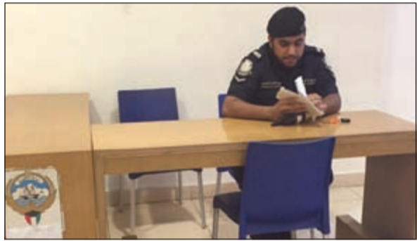
قطاع الأمن العام أقام نقاطا أمنية جديدة في بعض الاسواق

الطلب منه تفتيش الشنطة رفض بزعم ان بها ملابس داخلية.