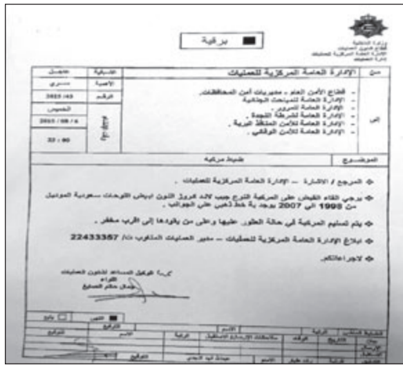
البرقية بشأن المركبة التي هرب بداخلها الشخص المشتبه به