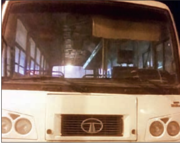
الباص مسروق الوافد للعمل عليه بدلا من العمل لدى الغير