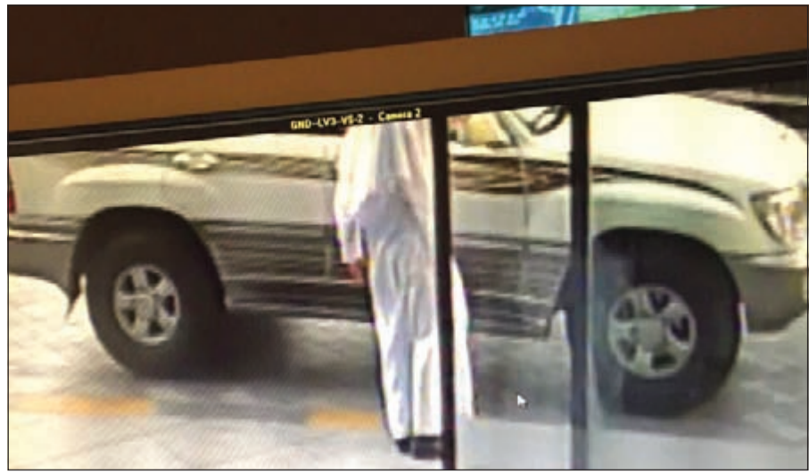
المركبة التي هرب فيها المشتبه به وتم التعميم عليها