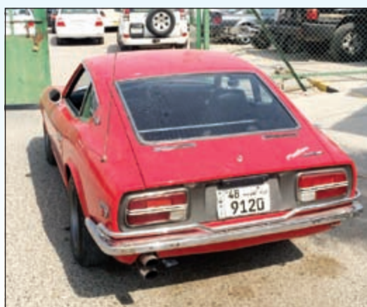
السيارات المخالفة الي كراج الحجز

انتفض قطاع الامن العام يوم امس ليشن حملة جديدة ضد المستهترين في نطاق محافظة الجهراء، وبحسب مصدر امني فإن الحملة التي أقدم على تنفيذها يوم امس مدير امن الجهراء بالإنابة العقيد وليد الشهاب جاءت عقب شكوى الى وكيل وزارة الداخلية المساعد لشؤون الأمن العام اللواء عبد الفتاح العلي خلال لقائه بالمواطنين والمقيمين في ديوانية الأمن العام يوم الاثنين من كل الاسبوع عن استفحال ظاهرة الاستهتار مرة اخرى وعودة المستهترين الى ممارسة أنشطتهم المزعجة والمعيبة، وتعريض حياة الآخرين للخطر وبحسب مصدر امني فإن حملة امن الجهراء شملت عدة تجمعات للمستهترين وخلال الحملة التي امتدت الى 3 ساعات وكانت بحضور واشرف اللواء العلي تم تحرير نحو 60 مخالفة مرورية وضبط عدة مركبات لبيان الاصابات بها.