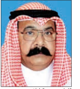
اللواء محمود الطباخ

تسبب باص مسروق في وقوف رجال مباحث الفروانية مكتوفي الايدي أمام ابعاد وافد هندي دخل البلاد بشكل غير قانوني، وبعد التواصل بين رجال مباحث الفروانية ومدير عام الادارة العامة للمباحث الجنائية اللواء محمود الطباخ فقد تقرر احالة الوافد الى النيابة بتهم تتعلق بالدخول الى البلاد بشكل غير قانوني الى جانب ارتكابه عدة سرقات ومن بين السرقات باص من الحجم الكبير.