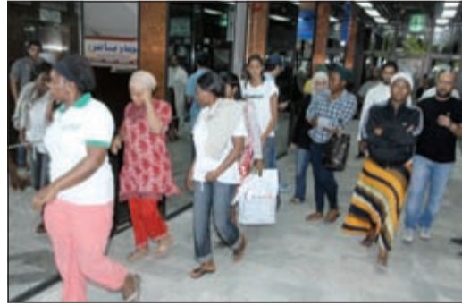
المخالفات داخل مكاتب الخدم إلى الإبعاد الإداري