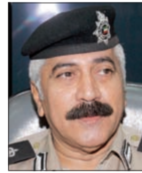
اللواء محمود الدوسري

المجمعات التجارية، مساء يوم امس الاول حادثة غريبة تمثلت في محاولة شخص مجهول الهوية يبدو من ملبسه انه من احدى الدول المجاورة يحاول الوصول الى المجمع حاملا شنطة سفر تسحب على عجلات وذلك من داخل الموقف.