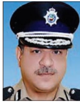
اللواء جمال الصايغ

وأشار المصدر الى ان التحدث في شأن الواقعة أمر سابق لأوانه، مشيرا الى ان كل الاحتمالات مفتوحة، رغم كونه بعيدا، ان الشخص وصل من المطار وكان سيلتقي برملائه داخل المجمع، واستطرد بالقول: ربما تكون هذه الفرضية ضعيفة نظرا لان السيارة التي اقلته من المطار حسب التوقيتات ليست تاكسي خاصة بالمطار وانما تاكسي جوال.