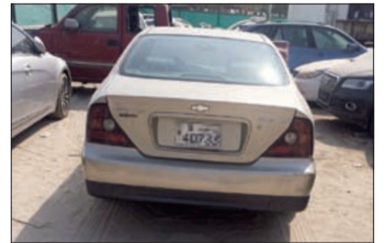
سيارة الاثيوبي التي استخدمها في «التتبع»

انتفض قطاع الامن العام يوم امس ليشن حملة جديدة ضد المستهترين في نطاق محافظة الجهراء، وبحسب مصدر امني فإن الحملة التي أقدم على تنفيذها يوم امس مدير امن الجهراء بالإنابة العقيد وليد الشهاب جاءت عقب شكوى الى وكيل وزارة الداخلية المساعد لشؤون الأمن العام اللواء عبد الفتاح العلي خلال لقائه بالمواطنين والمقيمين في ديوانية الأمن العام يوم الاثنين من كل الاسبوع عن استفحال ظاهرة الاستهتار مرة اخرى وعودة المستهترين الى ممارسة أنشطتهم المزعجة والمعيبة، وتعريض حياة الآخرين للخطر وبحسب مصدر امني فإن حملة امن الجهراء شملت عدة تجمعات للمستهترين وخلال الحملة التي امتدت الى 3 ساعات وكانت بحضور واشرف اللواء العلي تم تحرير نحو 60 مخالفة مرورية وضبط عدة مركبات لبيان الاصابات بها.