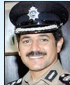
العقيد وليد الشهاب