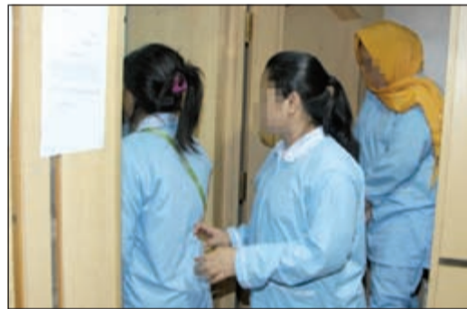
غرف سرية داخل المكاتب المخالفة لإخفاء الخادمت بها

الهارب زعم وجود ملابس داخلية بها ورفض التفتيش بناء على تعليمات نائب رئيس مجلس الوزراء ووزير الداخلية الشيخ محمد الخالد ووكيل وزارة الداخلية بالإنابة اللواء محمود الدوسري شهدت البلاد وفي غضون الساعات القليلة الماضية، خصوصا بعد حادثة المملكة العربية السعودية الإرهابي أمس الأول زيادة في الإجراءات الأمنية المتبعة في عموم الأسواق التجارية مساء الخميس وكذلك في عموم مساجد الكويت ظهيرة يوم الجمعة، وبحسب مصدر أمني فإن وكيل وزارة الداخلية المساعد لشؤون الأمن العام اللواء عبدالفتاح العلي أمر أمس الأول وأمس بنشر دوريات فسي وضعية ثبوت على عموم أسواق الكويت هذا الى جانب إصدار أوامره بوضع نقاط أمنية ثابتة في بعض الأسواق المهمة، وأشار المصدر الى ان مختلف أجهزة