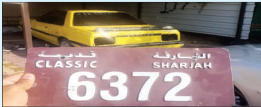
اغلب المركبات المستغلة في الاستهتار قديمة