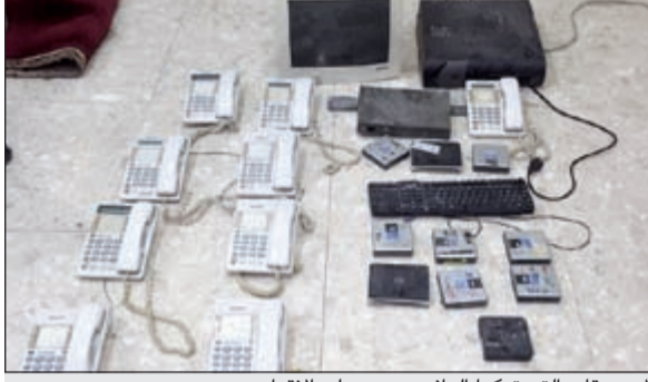
المسروقات التي تركها الوافد وهرب على الاقدام