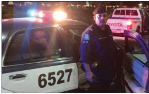
رجال الامن انتشروا يوم أمس الاول حول مختلف الاسواق التجارية