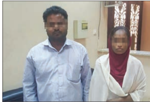
الأسوي مع صديقه