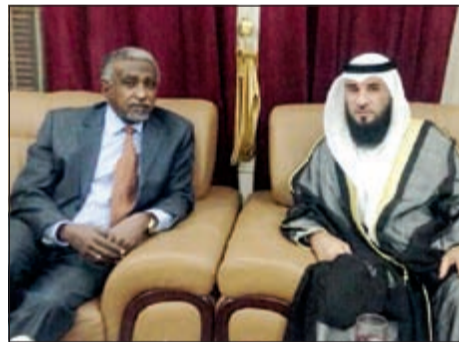
الكندري مع رئيس جامعة الخرطوم