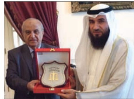
.. ويتبادل الدروع التذكارية مع رئيس مجلس الدولة