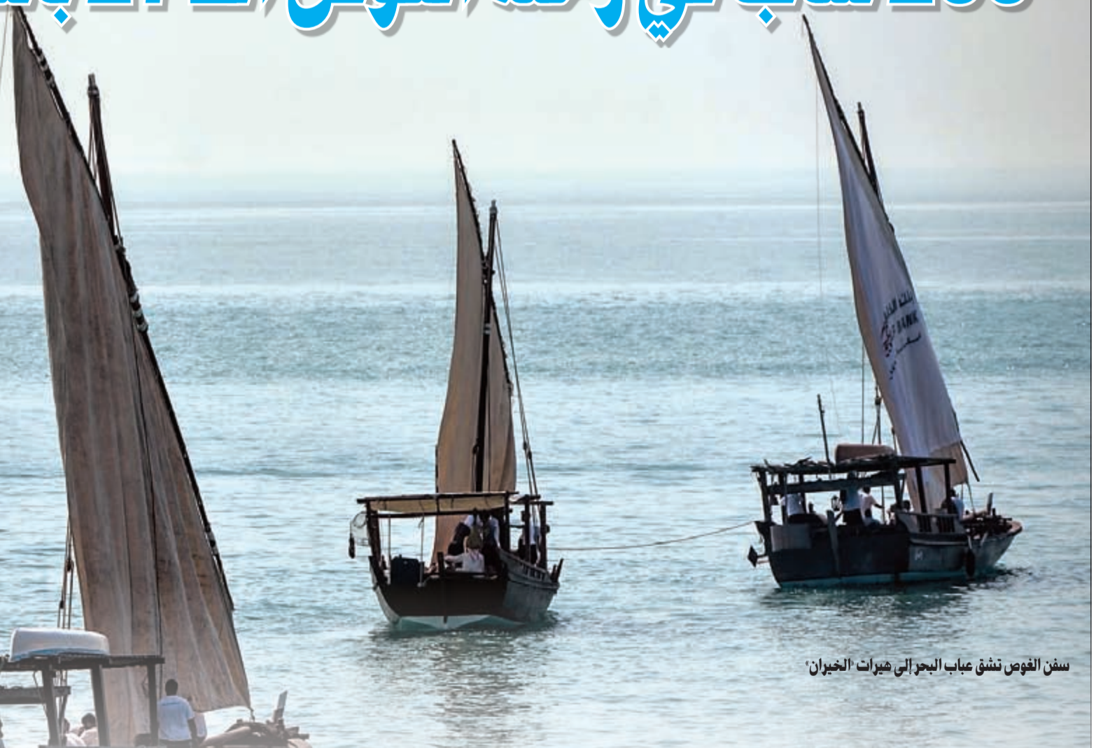
سفن الغوص تنشق عباب البحر إلى هيرات الخيران

علي القيندي إن جميع السفن المشاركة البالغ عددها 12 سفينة غوص وصلت بسلا إلى بندر الخيران مساء تقريبا يوم اول من امس بعد رحلة كانت فيها مستقرة بالرغم من ارتفاع معدل حرارة الجو والرطوبة وقد استطاع النواخذة الشباب الذين قادوا السفن تجاوز كافة المراحل بدءا من انطلاقتهم من ساحل النادي حتى وصولهم إلى بندر الغوص في منطقة الخيران، وهو المكان الذي ترسو به السفن، وقد أبدوا مهارتهم الفاتحة ومكاناتهم المتميزة في قيادة السفن فيما كان لبقية العاملين على السفن من المجدمية والبحرية حماسهم وتجاوبهم مع التعامل مع الحالات الصعبة والطارئة