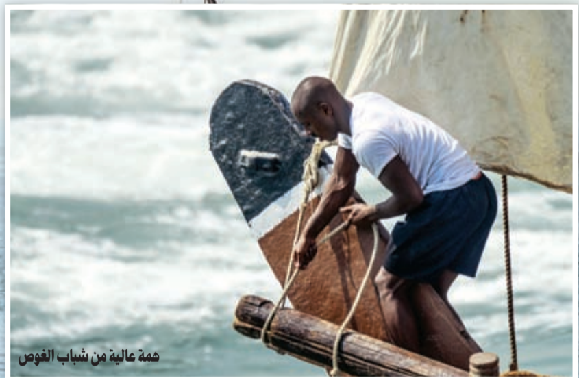
همة عالية من شباب الغوص