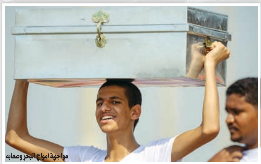
مواجهة أمواج البحر وصعابه