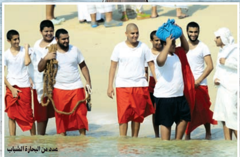
عدد من البحارة الشباب