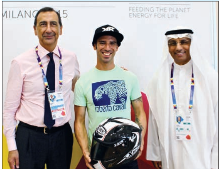
ماركو ميلاندي مع مازن الأنصاري والمفوض الوحيد لهيئة اكسبو ميلانو 2015 جوزيبي سالا

بالموضوعات التي نجح الجناح من خلالها ويتصميمه المبتكر في ابراز انجازات دولة الكويت ونهضتها المدهشة معربا عن تقديره الخاص لرسالة الجناح لاسيما على الصعيد الانساني وفي مجال الاستدامة. ولغت الى أن الرياضي الايطالي المرموق عبر عن رغبته في زيارة الكويت والتعرف اليها ورؤيتها من قريب مدفوعا بما شاهده ولمسه في أنحاء الجناح الذي قال انه أول جناح يزوره في اكسبو ميلانو حيث استقبله المفوض الوحيد لهيئة الاكسبو جوزيبي سالا.