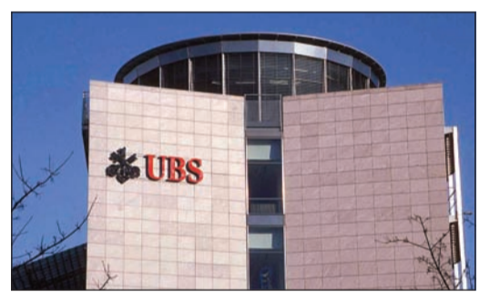
مقر بنك UBS في سويسرا

أكبر فضيحة مالية لبنك سويسري.. 14 بنكا و25 وسيطا ماليا متورطون بالتلاعب بأسعار العملات