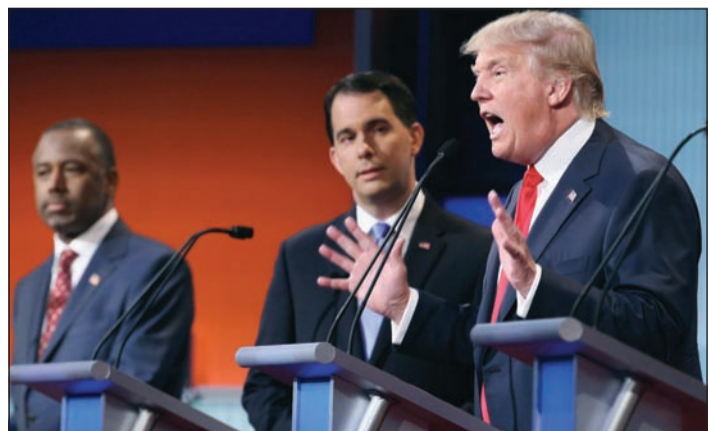
المرشح الجمهوري دونالد ترامب خلال المناظرة التلفزيونية ويبدو المرشحان سكوت ولكر وبين كارسون

المثيرة للجدل. فقد رفض اعلان الولاء انه لا يستبعد الترشح للانتخابات الرئاسية كاستقل اذا هزم في الاقتراع التمهيدي للحزب. وثار الضحك عندما ذكر بانه في الماضي قدم اموالا حتى لييل وهيلاري كلينتون واستصدر: «أعطيت الكثير من الاموال لمعظم الناس الموجودين على هذه المنصة الآن» لشراء دعمهم.