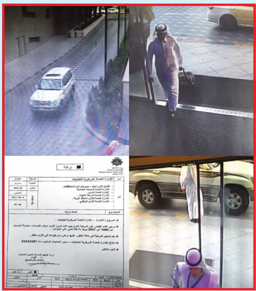
صورة ثلاثية لمحاولة شخص دخول أحد المجمعات ساحبا حقيبة سفر. وتعميم بضبط سيارة الدفع الرباعي التي هرب فيها