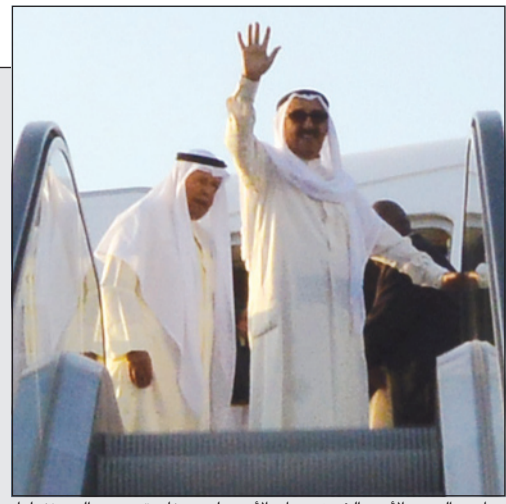
صاحب السمو الأمير الشيخ صباح الأحمد لدى مغادرته مصر إلى منفوعيا

الأمير: مشروع قناة السويس الجديدة سيرفع من مستوى قدرة مصر التنافسية في مجال التجارة العالمية