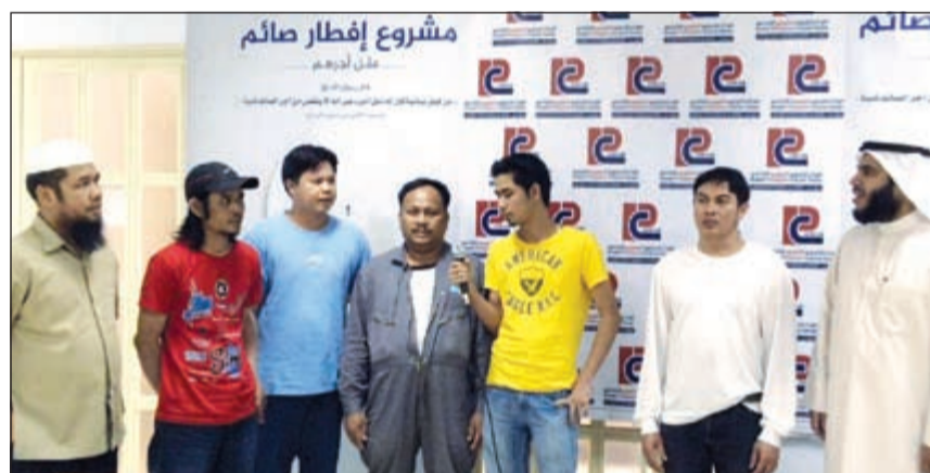
إشهار إسلام أحد المهتمين الجدد

التي تنمى ثقافة المهتمين الجدد، وتحفزهم على دعوة بني جلدتهم للتعرف على الإسلام، وتم ذلك توزيع 600 وجبة سحور على المشاركين في البرامج، علاوة على توزيع المواد التوعوية على الأسر وكذلك كان للمتميزين منهم نصيب من الجوائز التي قدمها المركز لتحفيزهم على الحضور والمشاركة في الأنشطة.