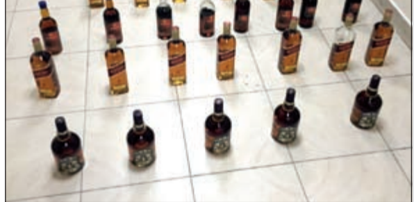
الخمور المضبوطة في شقة الأنس

أحال رجال إدارة مباحث الفروانية شخصين من غير محددتي الجنسية إلى النيابة لاتجارهما في الخمور لصالح شخص بدون، وقال مصدر أمني ان معلومات وردت إلى مدير مباحث الفروانية عن اشخاص يقومون بترويج مشروبات الكحولية بقصد التجار، حيث أوعز إلى رئيس مباحث الرابية والذي بدوره اتخذ ما يلزم من اجراءات قانونية بما فيها استصدار اذن نيابي، وتم لاتفاق من قبل احد المصادر على شراء كرتون خمر مستور في منطقة الفنطاس وتم ضبط الأشخاص بعد اتمام عملية الشراء والتسليم، وقد عثر في شقة أنس يستأجرها على 27 زجاجة خمر مستورد.