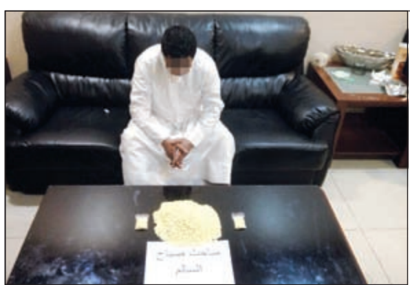
المواطن وإمامه المضبوطات من الحبوب

للاتصالات الدولية وأجهزة كمبيوتر وهواتف أرضية وجهاز سيرفر رئيسي و 80 بطل خمر محلي الصنع وأوراق خاصة بلعب القمار، حيث ضبط بحوزة القائمين على الوكر كمية من أوراق اللوتري.