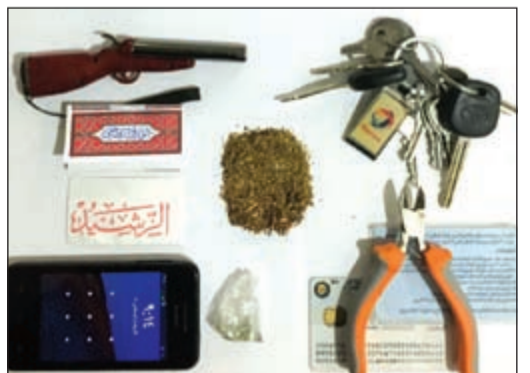
المخدرات أحييت إلى «المكافحة» والمتهم