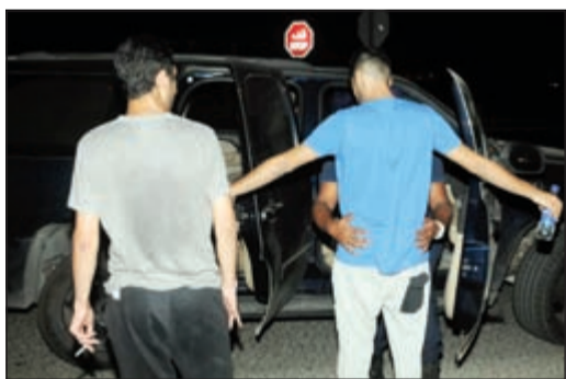
تفتيش الأشخاص ذاتيا حال الاشتباه

واصلت الأجهزة الأمنية الميدانية المعنية حملاتها التفتيشية على المركبات بحثا عن السلاح غير المرخص، حيث انطلق رجال الإدارة العامة لمباحث السلاح مساء الأربعاء الماضي في حملتهم السابعة بمحافظة حولي (منطقة الروضة)، ومحافظة العاصمة (منطقة الدعية)، وذلك بمشاركة قطاع المرور، وقطاع الأمن الخاص، وقطاع الأمن العام والنجدة والإدارة العامة للعلاقات والإعلام الأمني، في حملة تفتيش واسعة على المركبات والطرق والشوارع الرئيسية والفرعية بحثا عن الأسلحة غير المرخصة.