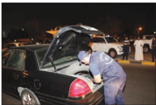
حملة السيارات تواصلت أمس بحثا عن أسلحة