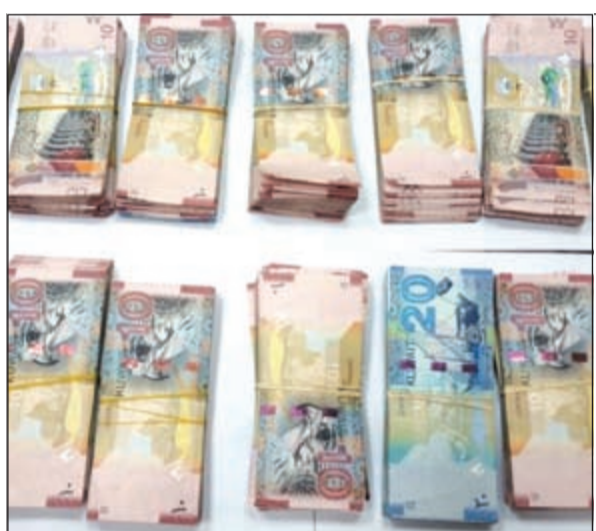
المبلغ النقدي الذي عثر عليه مع السوري

وأوضحت المصادر أن المتهم اعترف بأنه قام بسرقة