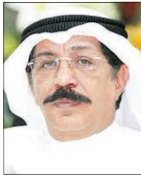
اللواء عبدالحميد العوضي

بتوجيهات من وكيل وزارة الداخلية المساعد لشؤون الأمن الجنائي اللواء عبدالحميد العوضي وتعليمات من مدير الإدارة العامة للمباحث الجنائية اللواء محمود الطماخ استطاع رجال مباحث الجليب ضبط شاب بدون متهم بقضايا سرقة سيارات وهواتف نقالة من مناطق عدة في البلاد، حيث قام المتهم بإحراق إحدى