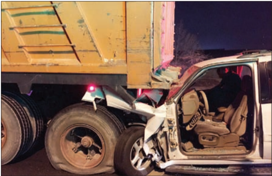
حادث التصادم العنيف على السابغ