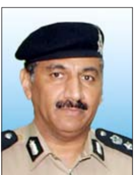
اللواء فهد الشويح

أمر مدير عام مديرية أمن الفروانية اللواء فهد الشويح بإحالة مواطن الى الإدارة العامة لمباحث السلاح بعد ان ضبط بحوزته على 4 أسلحة اقر بانها للتجار، على ان يحقق مع حائز الاسلحة لاحقاً لاتهامه بالتزوير في مستندات رسمية من خلال وضع لوحة على مركبة كان يستعملها ليست لوحقتها الاصلية، وهو ما يعني انه تحايل على القانون. وبحسب مصدر امني فإن حملة لرجال أمن الفروانية في منطقة صباح الناصر اوقفت مركبة حيث ظهر قائدها مرتبكا وشوهد في القعد الخلفي 4 أسلحة، وبالإستعلام عنه تبين انه مدين، وتبين ان المركبة وضع عليها لوحات مزورة.