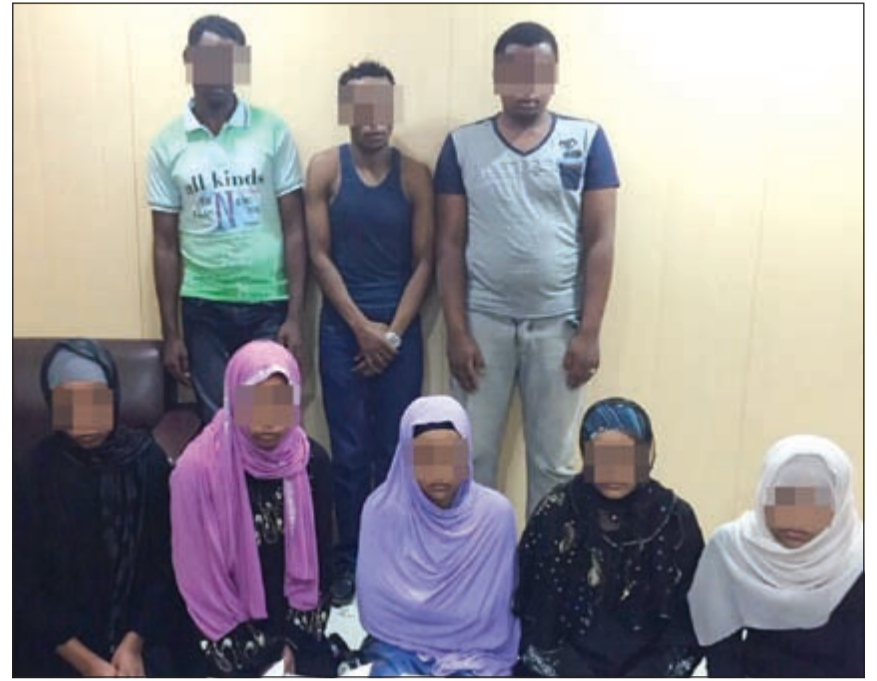
أعضاء التشكيل مطلوبون ومسجل بحقهم قضايا متنوعة