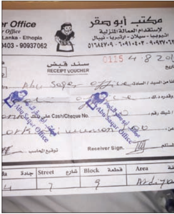
الإيصالات التي يقدمونها للمجنى عليهم مزورة