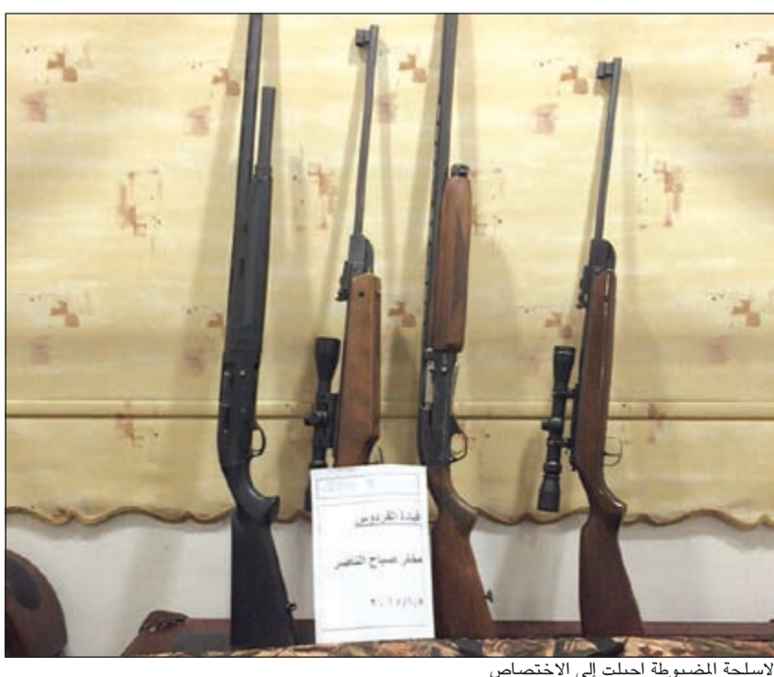
الاسلحة المضبوطة احيلت إلى الاختصاص