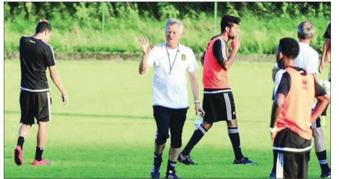
الروماني لازلو بولوني أكبر المدربين عمرا في السعودية

الصربي ديميتري الذي كان يبلغ من العمر 63 عاما، بينما العام الذي يليه حقق الهلال الدوري بكرة أولاريو كوزمين ابن الـ 39 عاما، الأرجنتيني كالديرون صاحب 49 عاما حقق نسخة 2009 مع الاتحاد. ولكن في 2010 حقق الهلال مع البلجيكي غيرتس الذي كان يبلغ 56 عاما، وأما الهلال يتصدر المشهد فقد حافظ على لقبه مع الأرجنتيني كالديرون الذي كان يبلغ من العمر 51 عاما. البلجيكي ميشيل برونوم حقق الدوري للشبابين وعمره 53 سنة، وفي موسم 2012 حضر ابن تونس فتحي الجبال، وحقّق اللقب للفتح من بين أنياب الكبار.