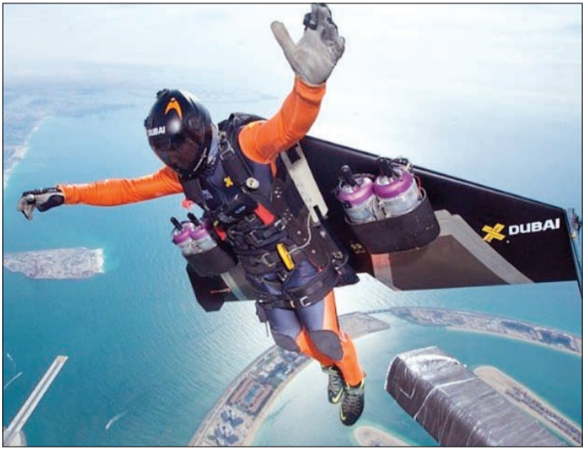
حسين الجسمي وهو يطير

شارك الفنان الإماراتي حسين الجسمي، جمهوره عبر صفحته الشخصية بموقع «إنستغرام»، بصورة من تجربة الطيران منفردا التي قام بها، والتي تعد الأولى في حياته، وظهر الجسمي في الصورة، وهو يرتدي بدلة حديثة مزودة ببعض الأجهزة التي تمكنه من الطيران من دون طائرة والتحكم في السماء، وتعد هذه الصورة إلى الأذهان الطريقة القديمة التي حاول عباس بن فرانس ابتكارها وكان له السبق في اختراعها، ولكن مع فارق التقدم التكنولوجي، حيث يتمكن الأشخاص مع هذه الآلة من التحليق بالأجسام والتمتع بالمناظر من الأعلى، مشيدا بالتجربة، وعلق عليها قائلا: «لا أصدق نفسي أنا طائر».