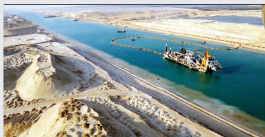
جانب من أعمال الحفر النهائي في المجري الملاحي الجديد للقناة

وأكد سلمان، أن الدولة تسعى لتقديم كل التسهيلات للمستثمر المصري والعربي والajنبي، موضحا أن الحوافز المنوحة في القرار رقم 17 لسنة 2015 سيتم منحها للمستثمرين في محور القناة سواء حق انتفاع للأرض بقيمة منخفضة جدا ورد قيمة البنية الأساسية التي ينفقها المستثمر خلال 10 سنوات، إلى جانب تحمل الحكومة قيمة التأمينات والتي تمثل حصة صاحب العمل عن عماله لديه، وهو