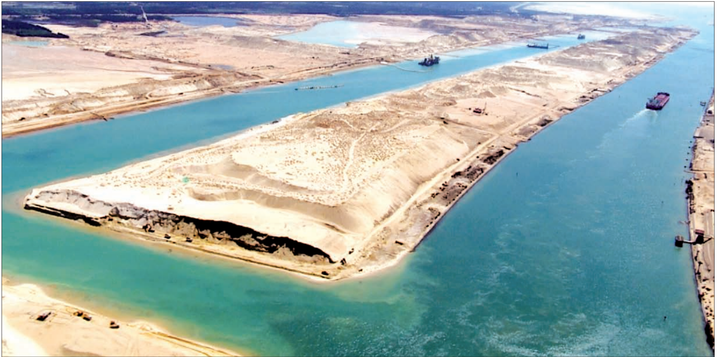
القناة الجديدة قلصت زمن عبور السفن وسمحت بمرورها بشكل متزامن في الاتجاهين

أن الشعب المصري لم يحقق تلك المعجزة لمصلحته فقط بل إن القناة الجديدة ستخدم العالم بأسره. وعلى الصعيد ذاته، قالت هيئة السكك الحديدية أنها انتهت من تركيب شاشات عرض في محطتي مصر بالقاهرة وسيدى جابر بالإسكندرية، من أجل إذاعة احتفالية القناة على الهواء مباشرة. كما تدع محطات الخطين الثاني والثالث بمترو الأنفاق عبر إذاعاتها الداخلية الحفل مباشرة.