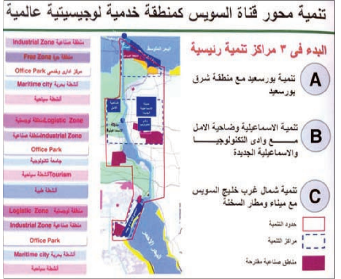
مخطط مشروع تنمية محور قناة السويس

بالبطاقة الشمسية قدرة 2500 ميغاواط. ويهدف المشروع أيضا إلى استصلاح 210 أفدنة بمنطقة شمال سيناء ووديان البروك وسهل وادي العريش. ويستفيد مشروع الاستزراع السمكي بقناة السويس من الميزة النسبية المتوافرة لمناطق القناة من حيث وفرة الإنتاج السمكي، كما يعمل المشروع على تحقيق الاكتفاء الذاتي للبلاد من بعض أنواع الأسماك.