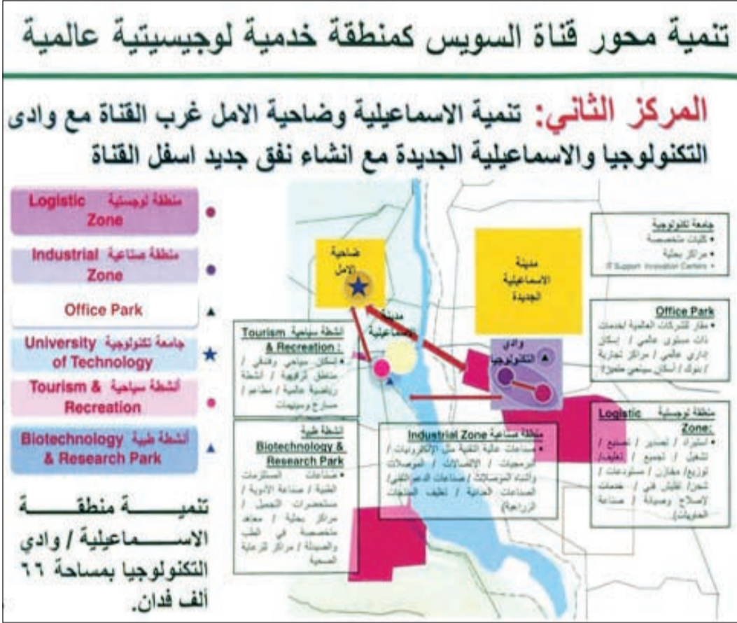
مخطط تطوير مدينة الإسماعيلية ضمن تنمية إقليم القناة