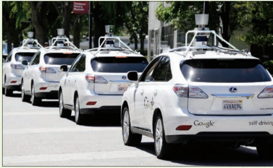
لكزس RX450h ذاتية القيادة

سيارة غوغل ذاتية القيادة هي من المشاريع الواعدة التي يعمل عليها في إنهاء الأخطاء البشرية الحاصلة خلف مقود السيارة من خلال حل برمجي متطور ألا وهو robo taxi. حيث سجلت أكثر من 700 ألف ساعة من تجارب وتشغيل المركبة منذ عام 2009 حين بدأ العمل به، وتتوقع غوغل أن تكون هذه السيارات جاهزة للاستعمال العام بين 2017 و2020. وقد سجل عملاق البحث على الإنترنت غوغل أكثر من 300 ألف ميل في اختبار سيارات تويوتا بريوس ذاتية القيادة التي جالت في شوارع المدينة والضواحي على حد سواء والآن قامت بإضافة سيارة هجينة أخرى إلى المجموعة، وهي لكزس RX450h، حيث تحول اهتمامها إلى ظروف الطريق الأكثر صعوبة، وفي الوقت الحالي، تختبر غوغل سيارتها ذاتية القيادة الجديدة في أوستين تكساس. ومؤخراً كشفت شركة غوغل عن اختبارات جديدة لسيارة غوغل في بيئات مختلفة لاختبار