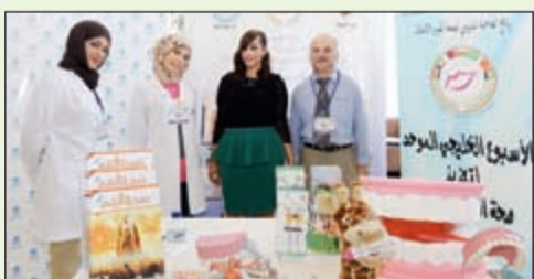
حصة التجارة من بنك برقان تتوسط أطباء برنامج العاصمة لصحة الفم والأسنان

نظم بنك برقان مؤخراً فحوصات الفم والأسنان لموظفيه وذلك بالتعاون مع وزارة الصحة - إدارة طب الأسنان التابعة لبرنامج العاصمة لصحة الفم والأسنان، وذلك كجزء من شركته مع برنامج العاصمة المدرسي لصحة الفم والأسنان لمدة عام كامل.