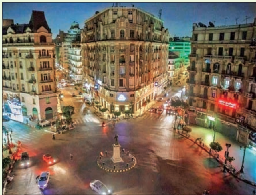
انخفاض أسعار تجاير المكاتب بوسط القاهرة فرصة كبيرة للمستثمرين

أقل من 30 دولاراً في المتر المربع شهرياً مع تحول غالبية الطلب تجاه المدن التابعة، لاسيما في القاهرة الجديدة. ينعكس نجاح «القاهرة الجديدة» في النمو القوي في الإيجارات في القطاع 2 على مدار العام الماضي، وهو ما يمكن أن يعزى إلى توافر بنية تحتية أفضل فضلاً عن سهولة الوصول وتوافر ساحات ركن السيارات. وقد ظلت الإيجارات في الأسواق الحضرية الكبرى بالقاهرة الجديدة وغرب القاهرة من دون تغيير على مدار الربع المعني.