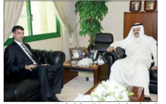
الشيخ أحمد النواف مستقبلاً عبدالعالي أنو المرتضى

أشاد محافظ حولي الفريق أول م. الشيخ أحمد النواف بعقد العلاقات الأخوية والوطيدة بين الكويت وليبيا، مؤكداً حرص الكويت على أمن واستقرار ليبيا في ظل ما تشهده من أحداث، ومعرباً عن الأمل في مزيد من التعاون لتعزيز العمل المشترك لما فيه صالح الشعوب العربية. وأوضح النواف عقب استقباله القائم بالأعمال بالسفارة الليبية لدى الكويت عبدالعالي أنو المرتضى في مكتبه بديوان عام المحافظة، أن الكويت دائماً ما تتقف إلى جانب الحق ومساندة الدول العربية الشقيقة.