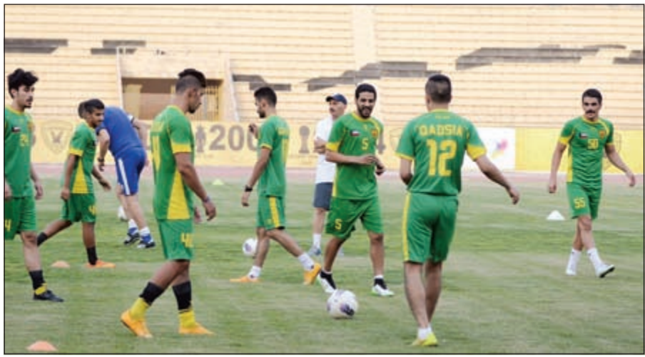
المركز الإعلامي بناي القادسية