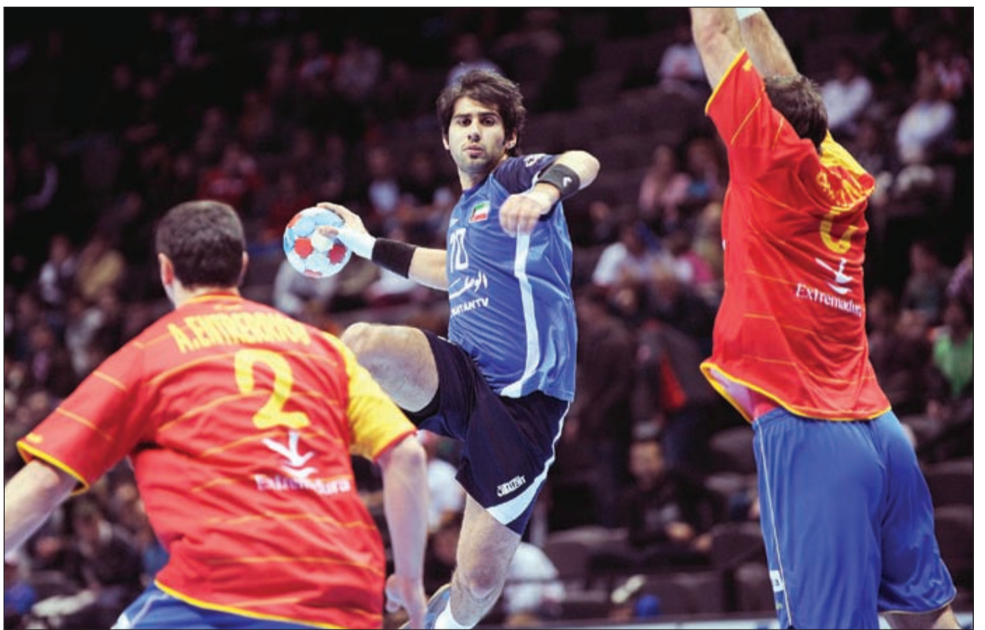
هل ستدخل كرة اليد في نفق مظلم؟

التحكم بالاتحادات الوطنية التي تتبع بمرجعيتها عادة إلى الجمعية العمومية التي تكون هي سيدة قراراتها، ومن يطلع على الكتاب المرسل من قبل «IHF» يلاحظ مدى التناقض في دوره بحماية استقلالية الرياضة مع تصرفه الديكتاتوري، حيث جاء فيه «إن الاتحاد الدولي لكرة اليد بالتعاون مع اللجنة الأولمبية الدولية يقوم بحماية الاستقلال الذاتي للاتحادات الوطنية طبقا لأحكام النظام الأساسي الخاص به (المادة 7 - 2 نقطة 4 والمادة 8) والميثاق الأولمبي للجنة الأولمبية الدولية»، إلا أن الواقع يقول عكس ذلك تماما فهو سحب استغرد بكافة تفاصيل القرار.