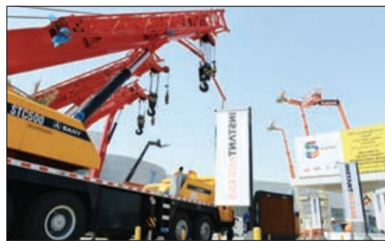
لقطة أرشيفية للمعرض السابق