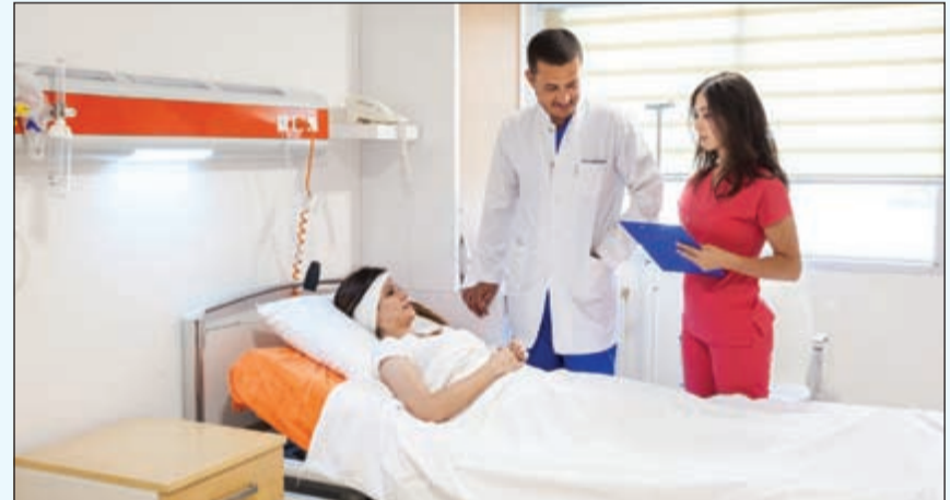
متخصصون في المتابعة الطبية الراقية

يعود تاريخ السياحة الطبية إلى آلاف السنين عن طريق السياح اليونانيين الذين تجاوزوا البحر الأبيض وأسسوا منطقة صغيرة تدعى (Epidauria) وذهبوا إلى خليج سارونيك، هذه المنطقة كانت توصف على مدى التاريخ بالكهنة الشفاء، وهي منطقة معبد (Asklepios) وقد أصبحت وجهة للسياحة الطبية، منذ القرن الثامن عشر، ويعتقد المرضى في إنجلترا بفعالية مياهها المعدنية للشفاء، وكانوا يذهبون إلى مدن «السبا» لتلخص من أمراض مثل النقرس والتلتهبات الكبد وأمراض الشعب الهوائية، وكانت منطقة الاناضول تعرف كاهم مركز للعلاج الطبي في تاريخ العالم.