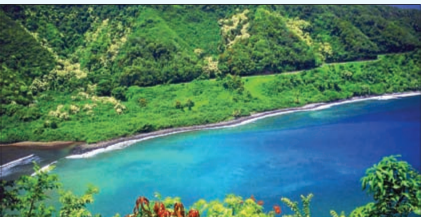
الهواء النقي والخضرة الغناء والمياه الرقراقاة من أهم عناصر العلاج الاستشفائي

تتنوع مناخاتها وطبيعتها الجغرافية بين الجبال والأودية والبحيرات والأنهار والينابيع. بالإضافة إلى ذلك فإن تركيا هي أكبر متحف طبيعي في العالم، وفيها ثالث أكثر الوجهات العالمية جذباً للسياح، وتمتاز بتعدد وتنوع مواقعها السياحية وكرم ضيافة شعبها ومطبخها الغني ووجباتها الحلال.