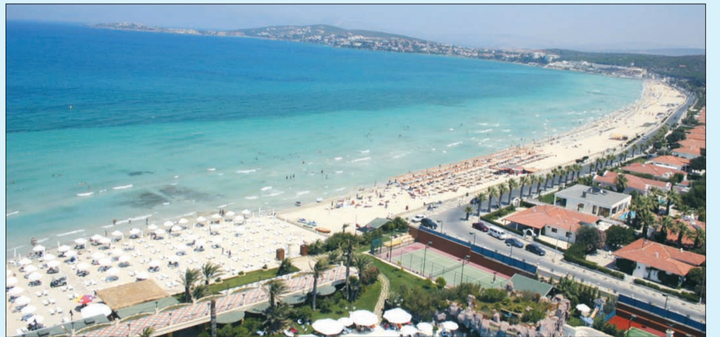
جانب من إزمير