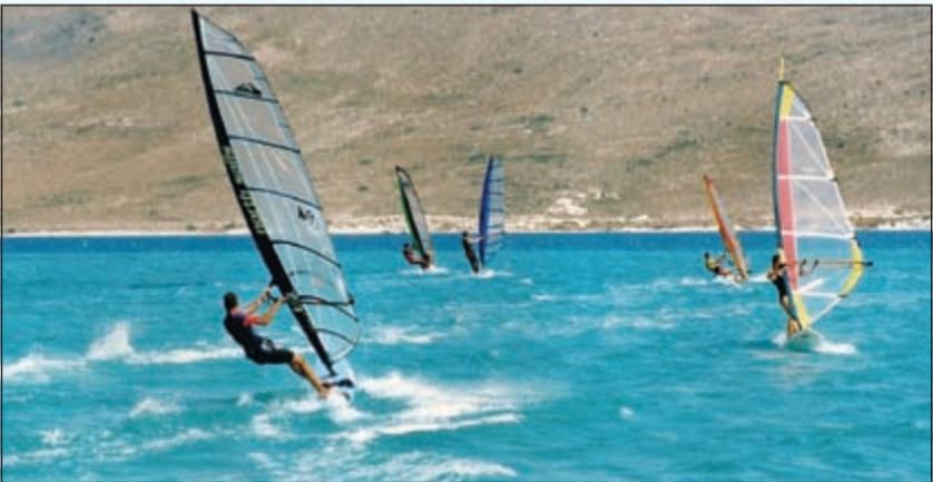
العلاج والاستجمام بين أحضان الطبيعة

السفر والفنادق، والنقل من وإلى الفندق، المطار، الفندق، أو التنقل من وإلى الفندق والمستشفى ثم الفندق إلى جانب إطلاقها لجولات سياحية خاصة في المدينة بإشراف دليل سياحي. وأما كبار الشخصيات (VIP) فسيتمتع ضيوفهم وأقاربهم بجميع الخدمات المقدمة لهم وذلك بناء على طلبهم واختيارهم للباقة التي من خلالها يتم نقل المريض من بلده للعلاج ومن ثم إعادته إلى بلده. ولتسهيل عمل السفر وضمان أرقى الخدمات تقوم «جولدن دكتورز» بالتعاون مع السفارة التركية في دولة الكويت والخطوط الجوية التركية لتسهيل حصولكم على التأشيرة المطلوبة ومنحكم تخفيضات سريعة على تذاكر السفر للمريض ومرافقيه تصل إلى 20٪.