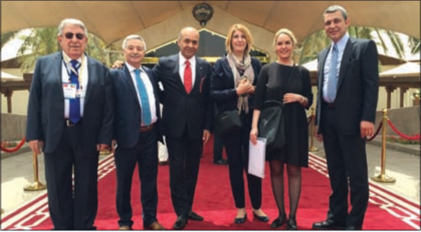
بسام يلدرم رئيساً لوفد غرفة التجارة التركية في إحدى زيارته لقصر بيان

الإسلامية العريقة وبمستشفياتها المجهزة بالشكل الأفضل عالمياً وبكوادرها وخبراتها المحلية ذات الشهادات الدولية، موجها دعوة إلى مسؤولي وزارة الصحة لزيارة تركيا والاطلاع على الخدمات المقدمة والجودة العالية المتوفرة والنتائج المحققة تمهيدا لتوقيع اتفاقية خاصة بالعلاج في الخارج لتحقيق الفائدة للطرفين. نحن نعلم أن هناك خصوصية لدى بعض الأسر الكويتية وعدم رغبة في العلاج بالخارج ولذلك نشجع وبقوة أن يتم تنفيذ مصحات علاجية متكاملة في الكويت وخصوصاً أن البعض قد لا تتوافر لديه إمكانات السفر واصطحاب المرافقين.