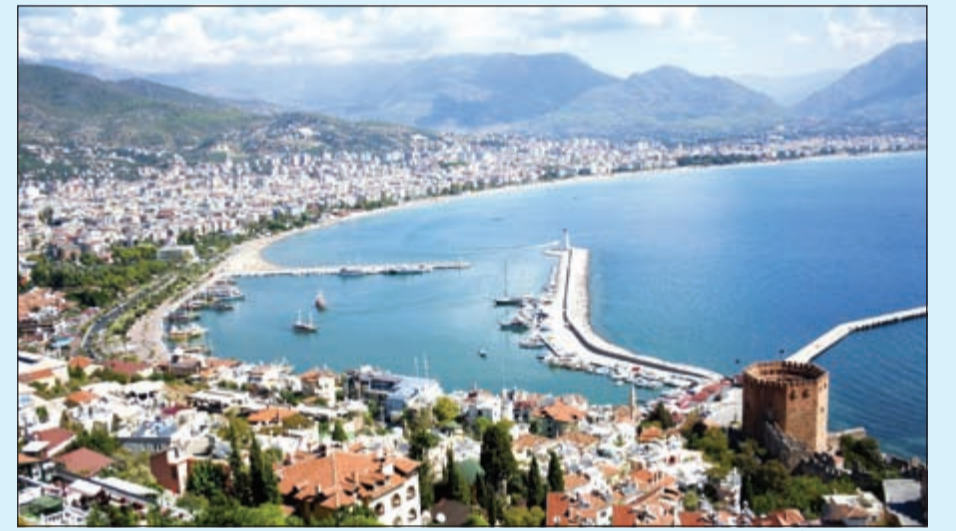
جانب من مدينة أنطاليا البحرية.. وتنوع الطبيعة الساحرة

يسؤالنا بسام الغرا يلدرم حول الأسعار المتعلقة بتكاليف العلاج، ذكر أن تركيا تتميز بانخفاض تكاليف العلاج فيها مقارنة بدول أوروبا الغربية والولايات المتحدة الأمريكية وهذا لا يعني انخفاض الجودة بل على العكس تماماً فجميع مستشفياتها ذات جودة عالية وتمتلك أعلى مستويات البنى التحتية والتكنولوجية ولدى معظم شركات الدواء العالمية تمثيل في تركيا سواء على شكل مصانع أو مقرات إقليمية، ويتميز الهلال