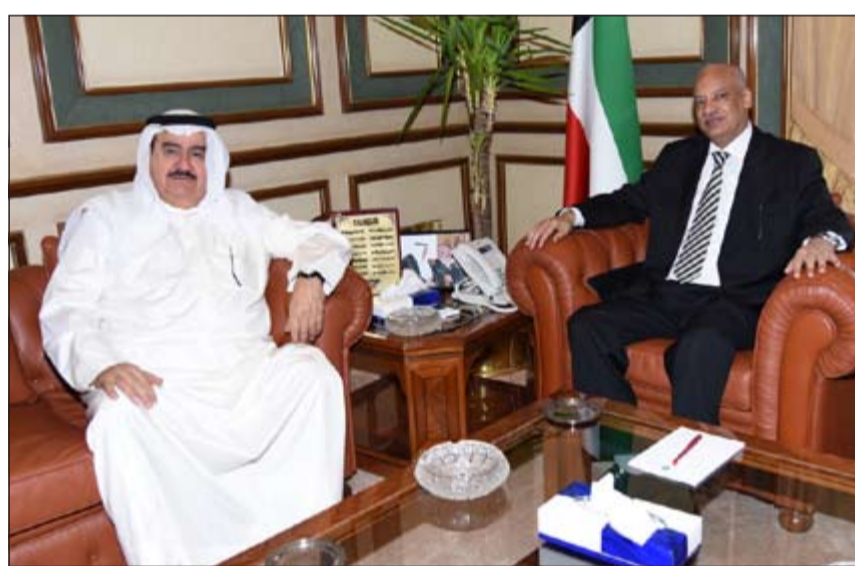
ثابت المهنا مستقبلا السفير عبدالكريم سليمان

استقبل محافظ العاصمة الفريق ثابت محمد المهنا سفير مصر لدى الكويت عبدالكريم سليمان، وذلك بمناسبة انتهاء مهام عمله في البلاد. وقد رحب المحافظ بالسفير سليمان وتبادل معه الأحاديث حول العلاقات الثنائية وسبل تعزيزها في مختلف المجالات كما تمت مناقشة بعض الموضوعات ذات الاهتمام المشترك. وفي نهاية اللقاء أعرب المهنا عن عميق شكره وتقديره للسفير سليمان، متمنيا له التوفيق في عمله المستقبلي ثم قدم له درعا تذكارية. من جانبه، شكر السفير سليمان المحافظ على حفاوته وترحيبه، متمنيا للكويت أميرا وحكومة وشعبا دوام التقدم والازدهار. كما استقبل المحافظ في وقت لاحق سعادة عبدالعالي أنور محمود القائم بأعمال سفارة دولة ليبيا لدى البلاد. ورحب المحافظ بالضيف وتمت مناقشة العديد من الموضوعات ذات الاهتمام المشترك كما تم تبادل الأحاديث الودية التي تتعلق بتعزيز العلاقات الثنائية بين البلدين الشقيقين ودفعها إلى آفاق أرحب. وفي نهاية الزيارة قدم المهنا للقائم بالأعمال الليبي درعا تذكارية.