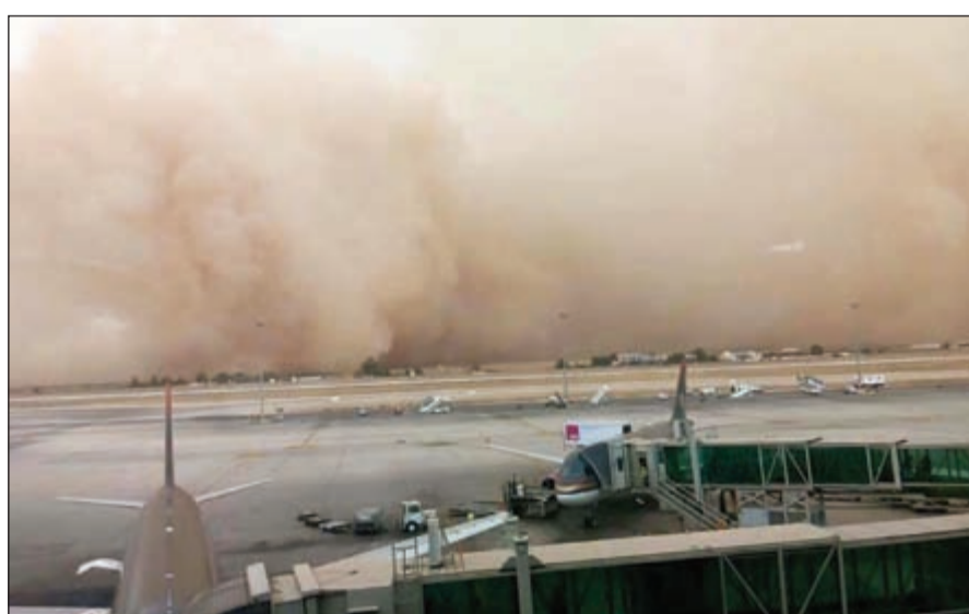
العاصفة الرملية تضرب مطار الملكة علياء

وصحبها تساقط زخات مطرية وعلى الطريق الصحراوي طوال ظهر أمس خاصة بمنطقة ضبعاء، كما سجلت درجات الحرارة في بعض المناطق 52 درجة مئوية، كما بين الجهاز الالكتروني بجامعة العلوم والتكنولوجيا.