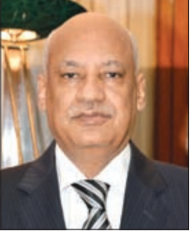
السفير المصري عبدالكريم سليمان

السفير المصري عبدالكريم سليمان لـ «الأنباء»: بدء تشيد مبنى السفارة الجديد في نوفمبر.. ومتفائلون بتصريح العيسى عن إنشاء مدرسة للجالية