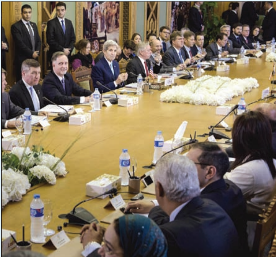
وزير الخارجية الأميركي جون كيري مترشدا الجانب الأميركي على طاولة الحوار الاستراتيجي مع مصر

القاهرة - وكالات: أعاد وزير الخارجية الأميركي جون كيري أمس قطار الشراكة «الإستراتيجية» مع مصر إلى السكة، مؤكدا أهمية الدور المحوري الذي تقوم به اقليميا ودوليا لاسيما في جهود مكافحة الإرهاب. وقال كيري خلال ترؤسه أعمال الجولة الأولى من الحوار الإستراتيجي مع نظيره المصري سامح شكري، ان مصر دفعت ثمنا باهظا لمكافحة التطرف، وتعهد بمواصلة دعمها عسكريا وسياسيا واقتصاديا. ودافع الوزير الأميركي عن الاتفاق النووي الذي أبرمته القوى الكبرى مع إيران، مؤكدا أنه سيجعل الشرق الأوسط أكثر أمنا.