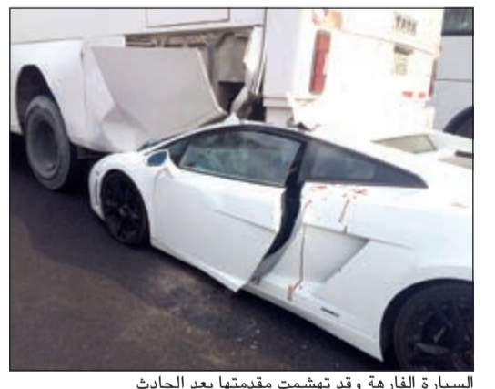
السيارة الفارهة وقد تهبمت مقدمتها بعد الحادث