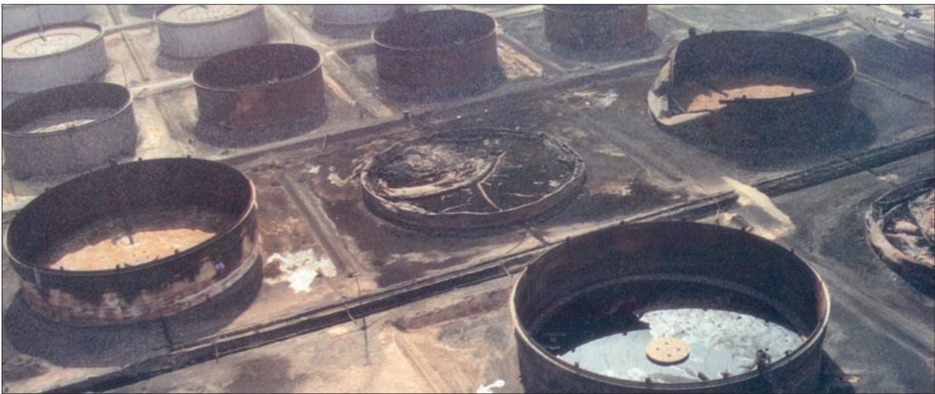
خزانات النفط والممار الذي لحق بها نتيجة الغزو العراقي للكويت

واستطرد أبو الحسن ان الاحتلال عكس مدى التلاحم ووحدة الصف وعدم التفرقة بين كل اطراف المجتمع الكويتي، وهي مبادئ رائعة تمسك بها الشعب الكويتي بشدة ابان الاحتلال العراقي الغاشم قبل 25 عاما من الآن، لافتا الى ان على الشعب الكويتي التمسك بالمبادئ التي أظهرها في فترة الغزو، خصوصا أننا