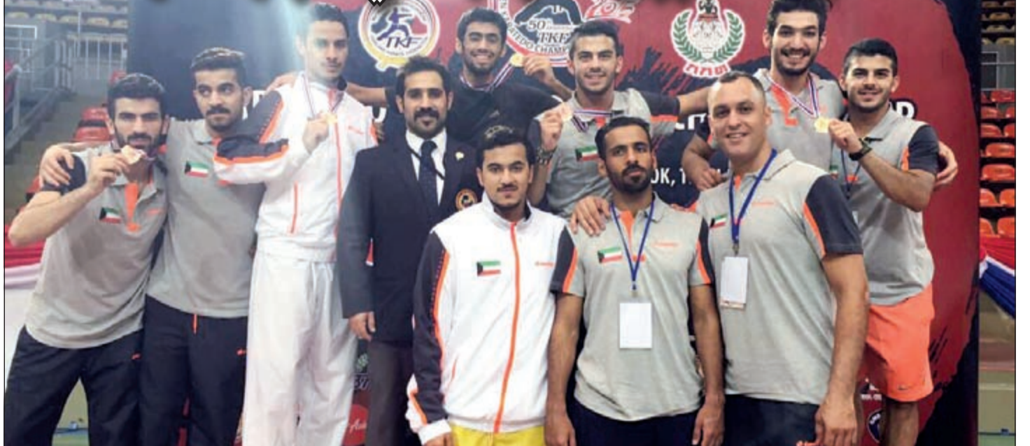
لاعب الكراتيه يتوجون بالذهب في بطولة تايلند

كما عودونا دائماً. وقال: «أثبت لاعبو الكراتيه أنهم أبطال من فني كل مشاركة يعودون محملين بالميداليات والإنجازات التي تسجل أسم الكراتيه الكويتية في سجل البطولات الدولية والقارية». وأضاف: ان المشاركة في بطولة تايلند الدولية، جاءت كنوع من الإعداد لاستحقاق أكبر وأهم وهي بطولة آسيا التي ستقام في اليابان ابتداء من الثالث من سبتمبر المقبل. وأكد ان اهتمام إدارة اتحاد