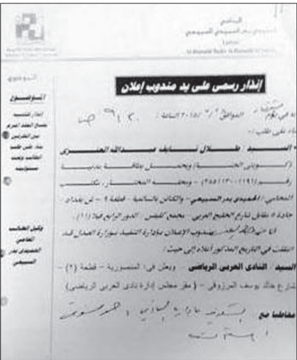
صورة ضوئية من إعلان المحكمة