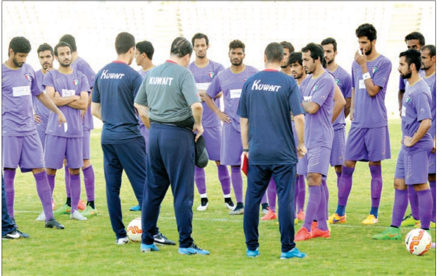
لاعب الأزرق منهم من اعتذر وآخرون استبعدوا قبل معسكر تركيا