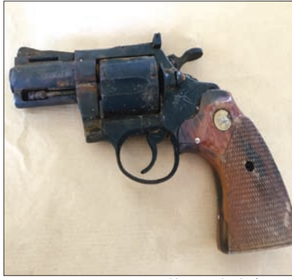
مسدس عثر عليه ملقى قرب شاطئ ترفيحي