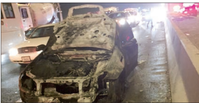
مركبة المواطن بعد اخماد الحريق

الى انقلاب مركبة والتي بداخلها الممرضة وابنها وزوجها وحريق الأخرى مركبة المواطن، وقام رجال الإطفاء بعملية الإنقاذ وأخرج المحشورين في المركبة كما قام رجال الإطفاء بمكافحة الحريق وإخماده، فيما قاموا بإنقاذ المركبة التي انقلبت وأخرج قائدتها الآسيوية وزوجها وابنها الصغير وتم تسليمهم الى الطوارئ الطبية لتلقي العلاج، هذا وسجلت قضية حادث.