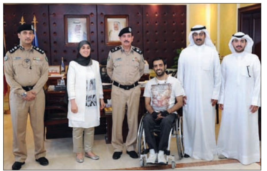
المهندسون وفريق «أتمنى» مع اللواء عبدالله المهنا

عرضت على المهنا مشروعا يصدد تقديمه الى وزارة الداخلية يساهم في التخفيف عن اخواننا المعاقين، موضحا ان المشروع يتضمن تمييز لوحات سيارات المعاقين مما يسهل عليهم قيادة سياراتهم ويزيد من عوامل الامان لهم. وأشاد المطيري بتعاون المهنا وفريق «أتمنى» مع الجمعية، موضحا ان تفعيل دور المجتمع المدني يساهم كثيرا في دعم العمل الرسمي بمختلف الجهات الحكومية، معربا عن الامل في ان يكون مشروع لوحات سيارات المعاقين واحدا من المبادرات التي ستلقى تعاوننا من الجهات المعنية.