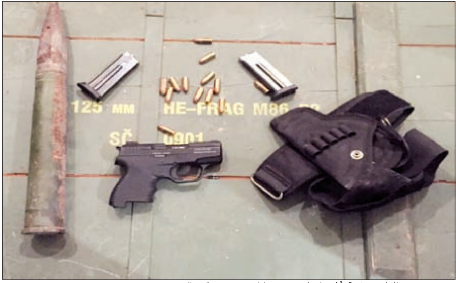
مسدس ربع وطلقات وقذيفة عُثر عليها بحوزة مواطن في سعد العبدالله