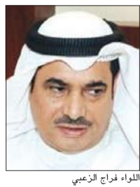
اللواء فراج الزعيبي

خطورة بالغة، حيث يمكن ان تقع تلك الأسلحة في ايدي الأشخاص غير المناسبين او مجرمين قد يرتكبون بها جرائم عنيفة، او ربما حتى اطفال يمكن ان تؤذيهم. وازداد اللجوء الزعيبي، في تصريح خاص لـ «الأنباء»: نحن رجال مباحث جمع السلاح لسنا مصمنا على رقاب المواطنين، كما ان القوانين وضعت للتنظيم