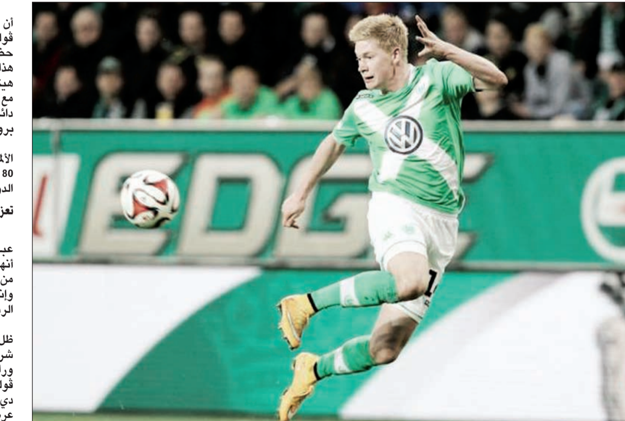
كيفن دي برون يقدم مستويات لافتة مع فولفسبورغ

ويتمنى دبتر هيكنغ أن يواصل مفتاح نجاح فولفسبورغ كيفن دي برون حضور التدريبات تحت قيادته هذا الموسم أيضاً، لكن أمنية هيكنغ تبقى صعبة التحقق مع دخول مان سيتي الإنجليزي دائرة الفرق المهتمة بضم دي برون إلى صفوفها. ونكّرت بعض الصحف الألمانية أن السيتي عرض مبلغ 80 مليون يورو للفوز بخدمات الدولي البلجيكي. تعزيب الموقف التفاوضي لكن إدارة نادي فولفسبورغ عبرت في مناسبات كثيرة عنها: «لا تتوخى الريح المادي وأنا تركز على مصلحة النادي الرياضية». ويبدو ذلك منطقياً في ظل وقوف راع سخني هو شركة فولكس واجن العملاقة وراءها، ويقي أمام إدارة نادي فولفسبورغ خياراً وحيداً لغني دي برون عن الرحيل هو تقديم عرض مالي مغر للرفع من قيمة أجره السنوي.