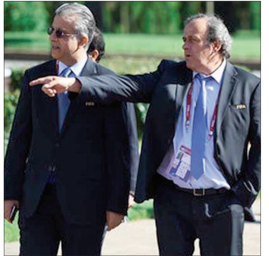
رؤية الفرنسي ميشال بلاتيني تحظى بتأييد الشيخ سلمان بن إبراهيم