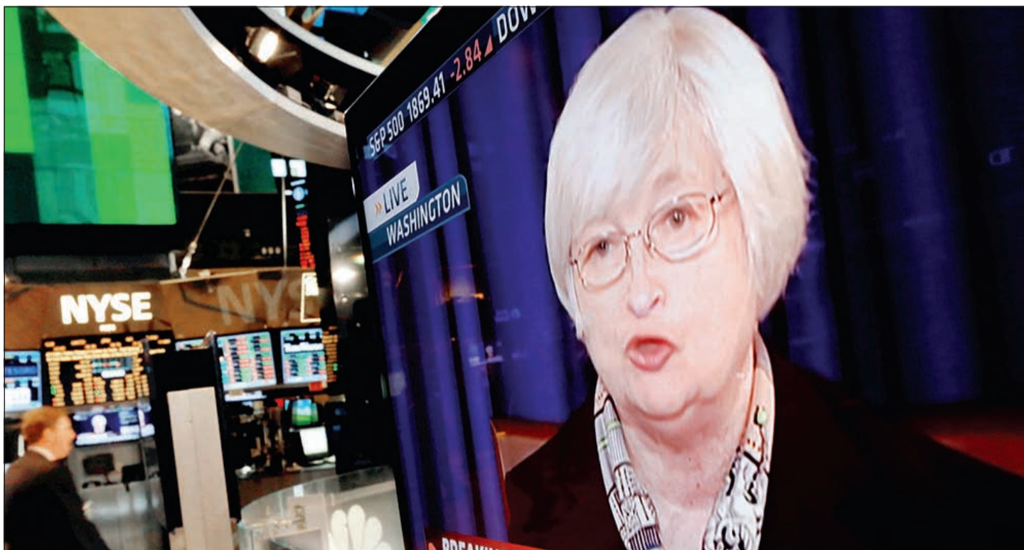
رئيسة مجلس الاحتياط الفيدرالي جانيت يلين

يتوقعون زيادة سعر الفائدة قبل نهاية العام الحالي إذا استمر تحسن الاقتصاد الأميركي وارتفع معدل التضخم الحالي المنخفض إلى 2%.