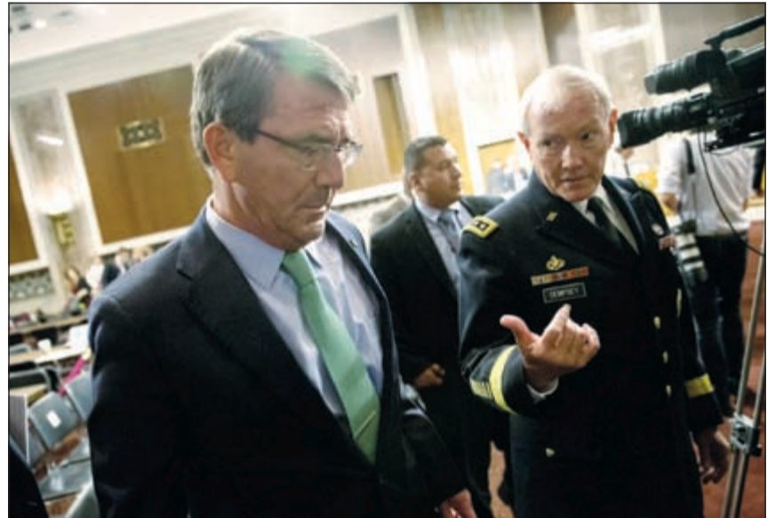
وزير الدفاع أشتون كارتر مع مدينتا رئيس الأركان مارتن ديمبسي بعد الاندلاء بشهائنها أمام لجنة الدفاع في مجلس الشيوخ

وفق فيها بين تاييده للاتفاق وبين بيانه للجنة في وقت سابق هذا الشهر بأنه لا ينبغي تحت أي ظرف تخفيف الضغط عن إيران فيما يتعلق بالصواريخ الباليستية والاتجار في الأسلحة.