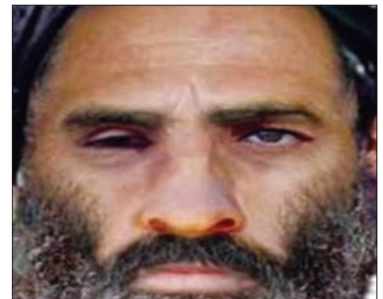
صورة أرشيفية للملا عمر زعيم «طالبان»

كابول - وكالات: أكدت الرئاسة الأفغانية وفاة زعيم حركة «طالبان» الملا محمد عمر في باكستان قبل عامين. وذكر مكتب الرئيس الأفغاني أشرف غني في بيان أمس أن «كابول خلصت إلى نتيجة مفادها وفاة زعيم الحركة المتشردة، استناداً إلى معلومات من مصادر موثوقة». واعتبرت كابول أن الطريق أمام إجراء محادثات للسلام أصبحت الآن مهيأة أكثر من قبل. وقال المتحدث باسم الاستخبارات الأفغانية حسيب صديقي ان «الملا عمر مات. لقد توفي في مستشفى بكراتشي جنوب باكستان في ابريل 2013 في ظروف غامضة».