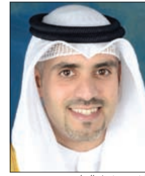
الشيخ مشعل الجابر

وقال الشيخ مشعل في مقابلة مع «الأنباء» ان الهيئة تسعى حالياً الى إنشاء 3 مناطق اقتصادية جديدة لتكون متاحة للمشاريع التي يرغب المستثمرون المحليون والأجانب في إطلاقها، عارضا قائمة من التسهيلات والمزايا للمستثمرين المحليين والأجانب، حيث أكد ان الهيئة تفتتح أبوابها لأي استثمار في الكويت سواء محلي أو أجنبي. وأكد ان اللائحة وضعت حدا أقصى للرد على أي طلب للاستثمار عند 30 يوماً، وهناك شبك واحد لتسهيل مهمة المستثمرين. وفي موضع آخر، قال ان كل القطاعات حالياً متاحة للاستثمار في الكويت ما عدا 10 قطاعات وضعت في قائمة سلبية تعتبر بين الاصفر في العالم.