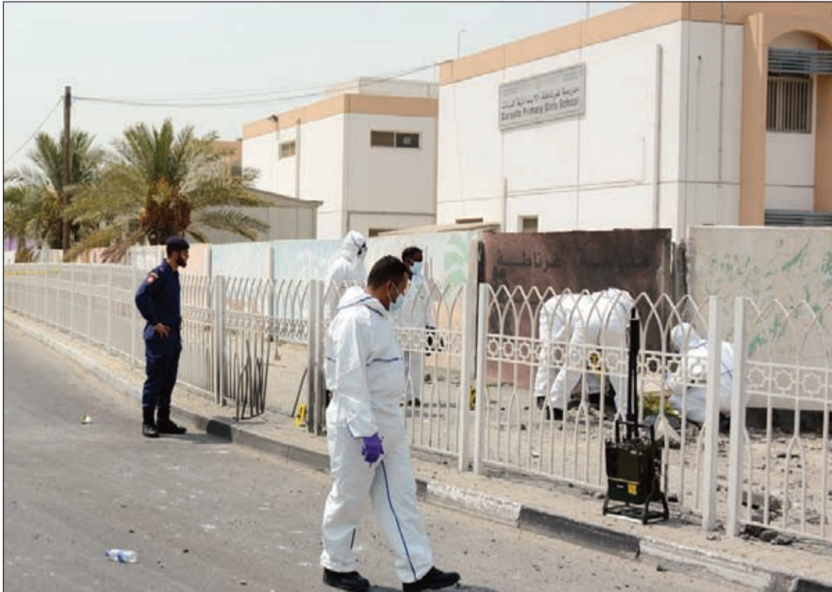
رجال المباحث والأمن يفتشون في موقع التفجير الذي وقع قرب مدرسة للبنات في قرية سترة أمس الأول (بنا)

عواصم - وكالات: أعلنت وكالة أنباء البحرين الرسمية (بنا) نقلاً عن وزارة الداخلية أنه تم تحديد هوية عدد من المشتبه بتورطهم في تفجير قرية سترة الذي وقع أمس الأول وأسفر عن مقتل شرطيين. ونقلت الوكالة عن رئيس الأمن العام طارق عيسى الحسن ان أعمال البحث والتحري التي تمت إثر «التفجير الإرهابي» تم تحديد هوية المشتبه في تورطهم في هذه الجريمة الإرهابية والقبض على عدد منهم. وكانت «بنا» قالت في تقاريرها: إن المعلومات الأولية «تثبت تورط طهران» في الحادث ولققت الى احباط محاولة تهريب أسلحة مصدرها إيران في عرض البحر قبل أيام. في سياق آخر، عبر وزير الخارجية الفرنسي لوران فابيويس من طهران أمس، عن أمه في فتح صفحة جديدة من العلاقات مع إيران تقوم على «الاحترام» وذلك بعد أسبوعين فقط على توقيع الاتفاق النووي بينها وبين الدول الكبرى. ونقل فابيويس أول وزير خارجية فرنسي يزور إيران منذ 12 عاماً. دعوة من الرئيس فرنسوا هولاند الى نظيره الإيراني حسن روحاني لزيارة فرنسا في نوفمبر.